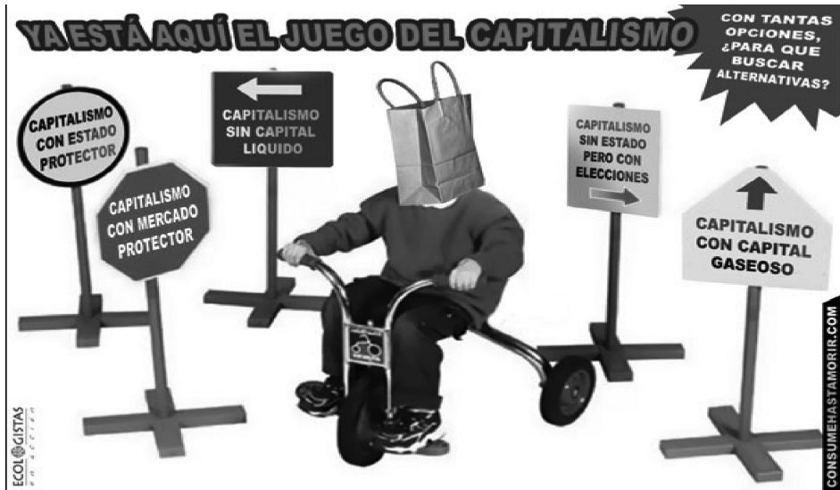
Imagen nº 2