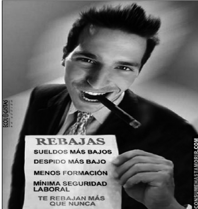
Imagen n° 6