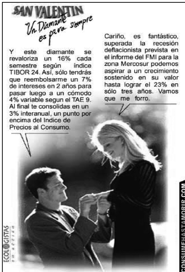
Imagen nº 3