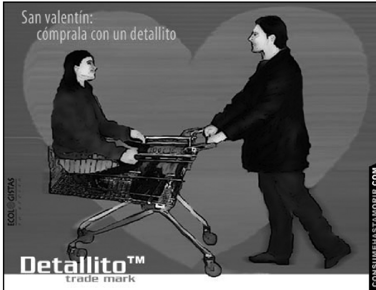
Imagen n° 4