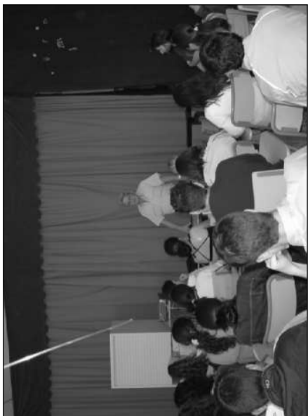
Charla sobre la emigración española en Alemania