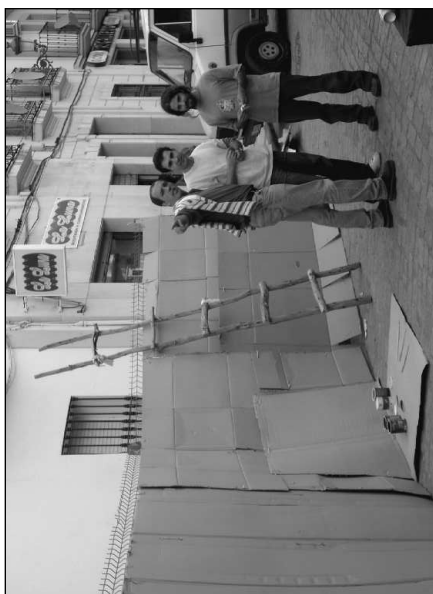
Construyendo El Muro “Guoman 06”