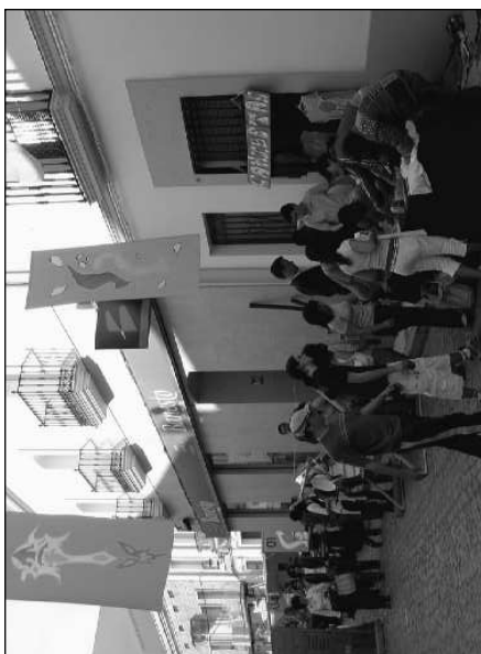
Taller de Camisetas “Guoman 06”