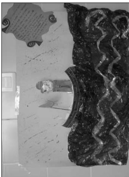
Concurso de carteles