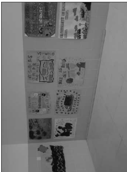
Concurso de carteles