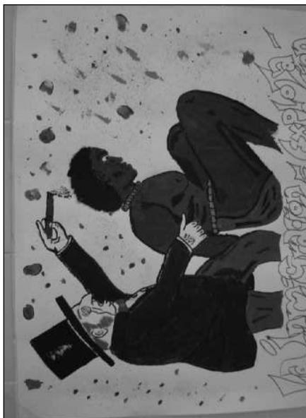
Concurso de carteles