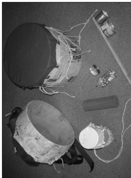
Taller de elaboración de instrumentos