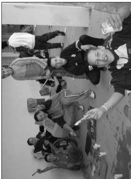
Reflexiones en El Muro “Guoman 06”