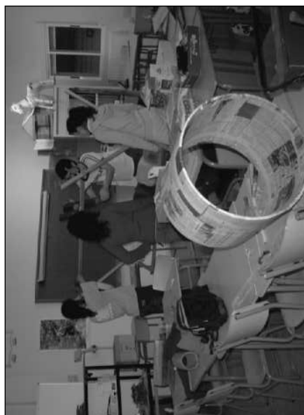
Taller de elaboración de instrumentos