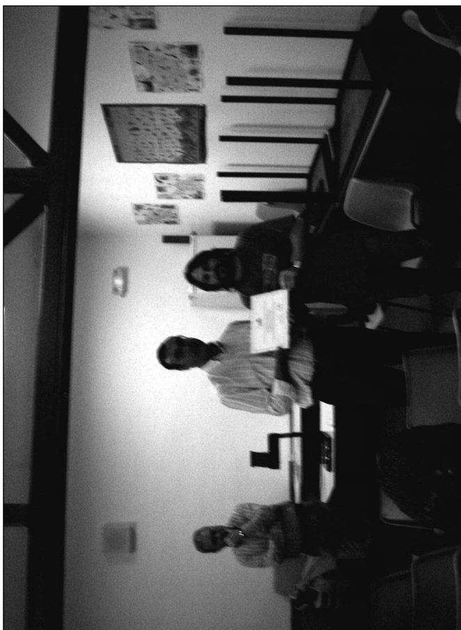
Entrega de placa Campaña Solidaria con CEAR