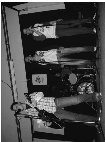
Concierto "Séptimo Cielo"