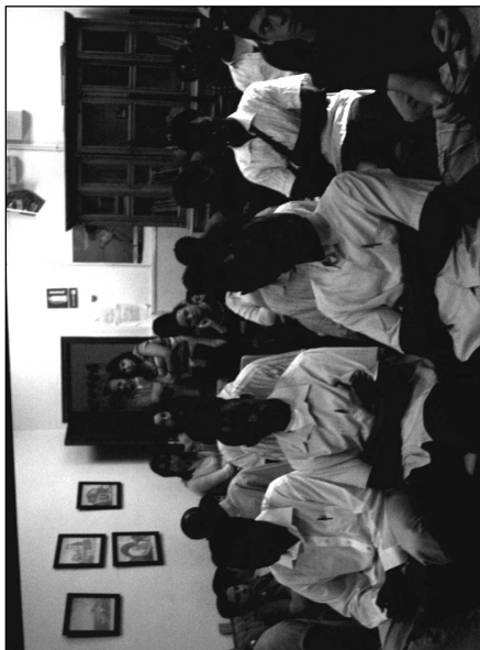
Encuentro con inmigrantes en el Centro de Acogida CEAR