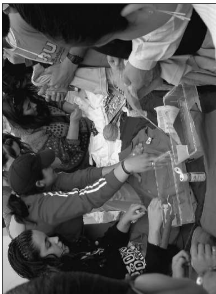
Taller de Camisetas “Guoman 06”