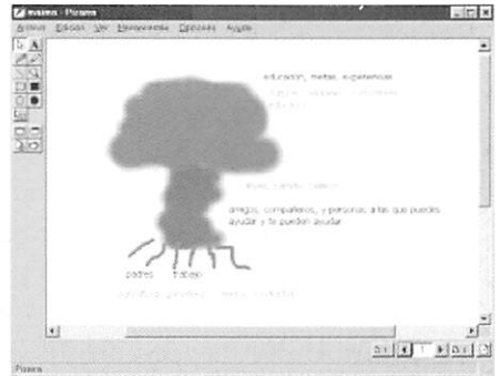
Pizarra virtual de Netmeeting sobre la que interactuaban ambos grupos siguiendo las instrucciones por voz de un moderador

Las comunicaciones se realizaban en tiempo real mediante videoconferencia. Con cinco horas de diferencia, los alumnos de Mar del Plata realizaron la actividad por la mañana mientras que los alumnos de Badajoz lo hacían por la tarde.