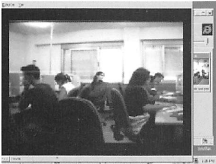
Uso del programa Netmeeting para videoconferencia

La orientación que se le ha dado a la actividad se basa principalmente en el conocimiento y la cohesión de los grupos participantes que, mediante tareas y actividades que requieren de la implicación de todos los miembros, han logrado que sean conocidas las características fundamentales de dos sociedades alejadas miles de kilómetros, y se hayan puesto en evidencia las necesidades y ventajas de dichas culturas desde su propia óptica y con la ayuda de las NN.TT.