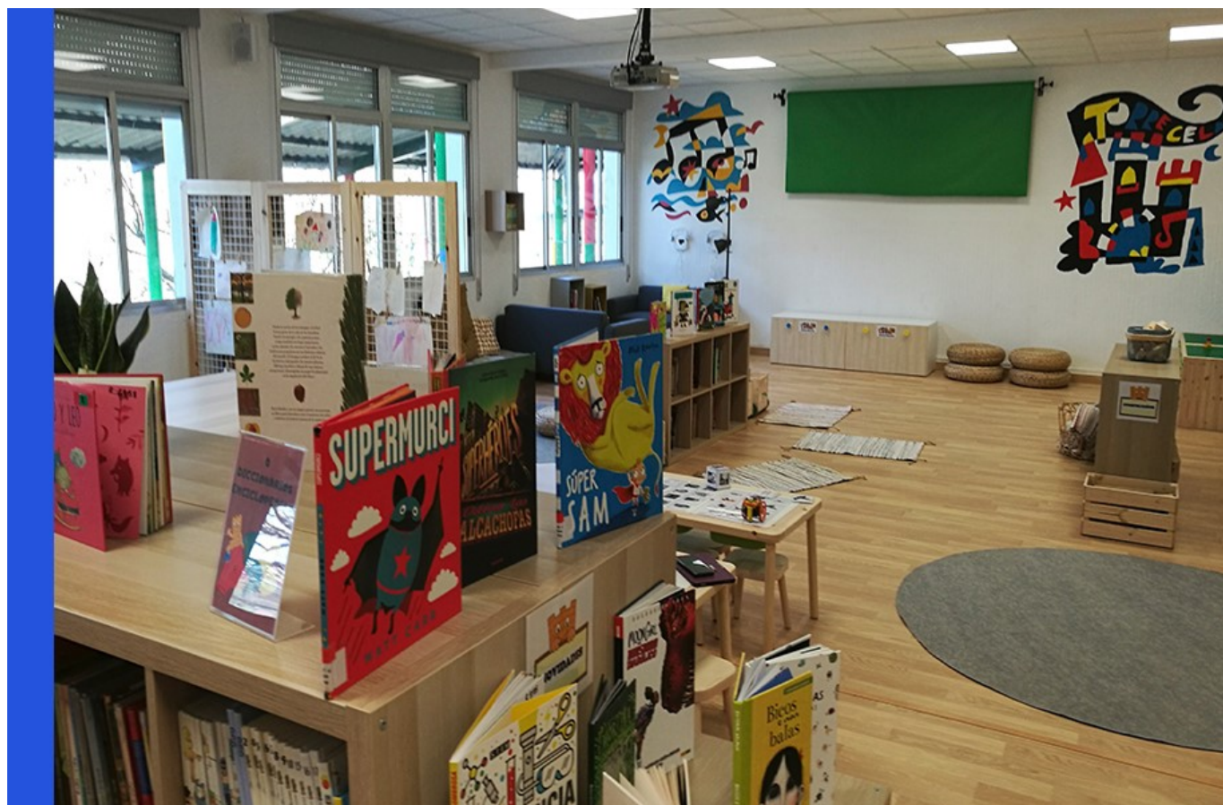
Biblioteca Luis Davila [8] , do CEIP Torre - Cela, de Bueu

Así o explicaba o primeiro texto normativo que lles concedeu carta de presentación e invitou a todos os centros educativos do país a deseñar e elaborar consensos sobre este particular eido educativo que se articula arredor da lectura, a escritura e as habilidades informativas, e que é tamén o eido esencial das bibliotecas escolares. Deste xeito comezou a perfilarse este noso compás para navegar.