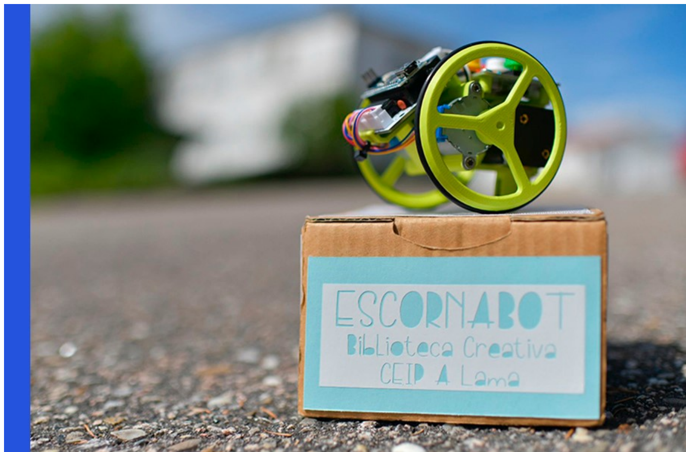
Escornabot viaxeiro. Programa de difusión de biblioteca creativa no CEIP de A Lama

educativo; e tamén é verdade que estes proxectos iniciais foron cedendo protagonismo aos plans anuais de biblioteca que reflicten como as ilusións de inicio se fan realidade ao longo do tempo, curso a curso. En xeral, o documento que manexamos decote nas bibliotecas escolares é o noso plan de traballo anual, ese plan sobre o que elaboramos unha memoria detallada cada fin de curso, a memoria que nos axuda a observar como avanza o noso plan de biblioteca, que resultados vai acadando ou cales serían, xa que logo, as liñas prioritarias ás que prestarlles atención no curso seguinte.