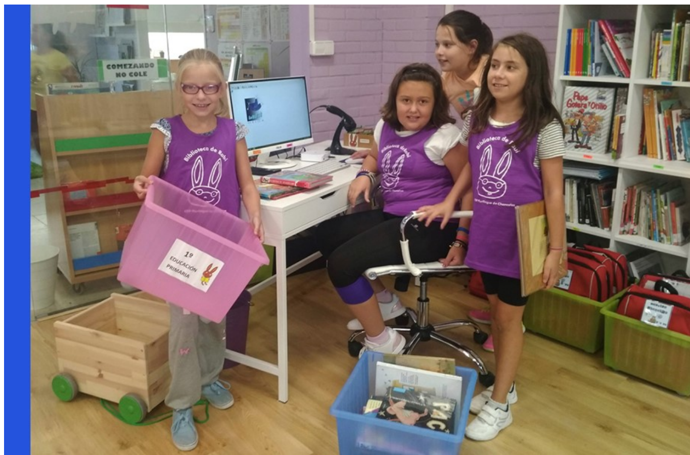
Equipo de voluntarias da Biblioteca de Rabi [4] (CEIP P. de Chancelas, en Combarro)

Pola súa parte, as ordes que desenvolven os decretos que regulan a ordenación e os currículos de educación infantil, primaria, secundaria obrigatoria e bacharelato na Comunidade Autónoma de Galicia establecen que os centros docentes deberán incluír dentro do seu proxecto educativo e funcional un plan de lectura e un plan de biblioteca.