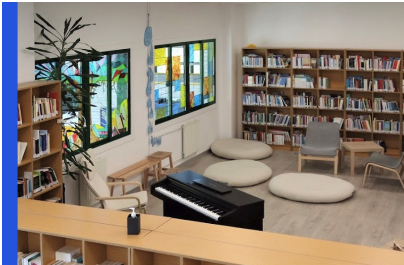
O Sobreiral das Palabras [13] . Biblioteca escolar do IES Valadares. Vigo

É media mañá e nun agocho subterráneo dun dos edificios da Cidade de Cultura, que acubilla enormes servidores informáticos, unha ardentía de luces de cores dá conta dos miles de movementos que se están a operar nos programas de xestión das bibliotecas escolares de institutos e escolas de todo o país, de préstamos e devolucións, de pescudas e reservas de libros, revistas, xogos e outros recursos. É o horario dos recreos, e de moitas das horas de ler. Nos servidores da plataforma dixital de préstamo E-LBE.2 dispáranse tamén os pedidos en liña, moitos deles mediados polos computadores de E-Dixgal, desde as bibliotecas ou desde as aulas. En Malpica de Bergantiños comeza a preparación dun menú saudable na cociña da biblioteca, mentres nunha escola infantil de Arteixo, os pequenos deseñan para imprimir en 3D pezas para reparar os seus robots Escornis; nun histórico instituto da Cidade das Murallas inauguran unha exposición de pintura, e no Rosal, un equipo de voluntarias decora os novos muros que amplían a biblioteca, á que chaman A Quinta dos libros, con imaxes enormes inspiradas na literatura tradicional; en Vigo, no Sobreiral das palabras, un grupo de alumnas está a gravar un audiovisual que incide na formación dos usuarios da biblioteca, mentres na escola de A Lama todo está disposto para as exposicións orais do proxecto documental: Previdos! Luces, cámara... acción!