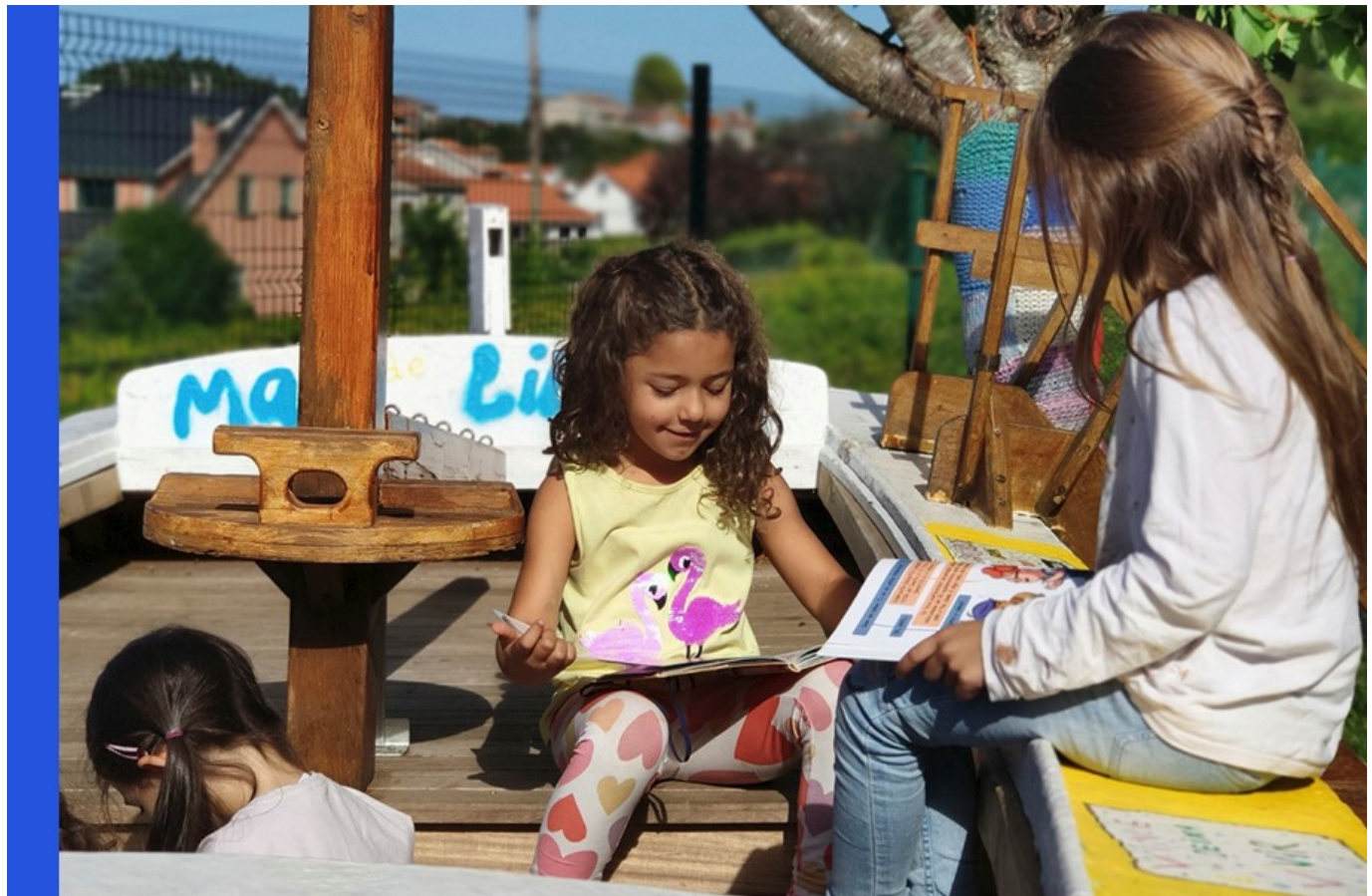
Punto de lectura - barco. Biblioteca do CEIP de Meaño [3] - As Covas