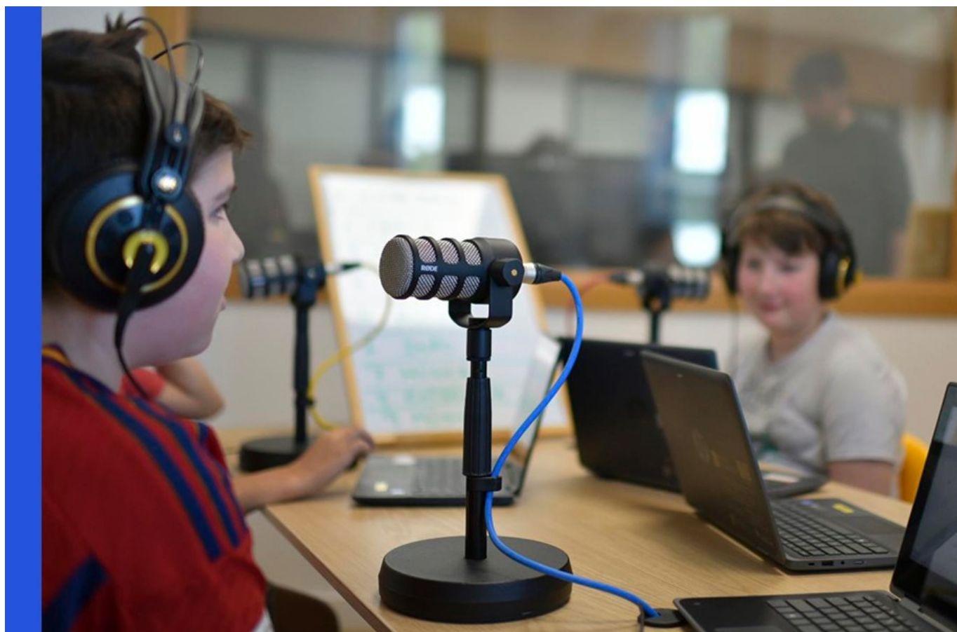
Emisora de radio do Recanto de Leo. Biblioteca escolar do CEIP A Lama

As nosas bitácoras susténtannos e permítenlles ás bibliotecas escolares afrontar cada marea, isto é, cada curso escolar, para seren útiles, inclusivas e atentas ás necesidades que xorden. A normativa actual solicítanos renovar os votos e consignar nun documento marco, de medio prazo, o noso plan de biblioteca , o que inspira e abeira estas bitácoras anuais. Non será tarefa difícil, pois xa o temos. A persoa responsable da biblioteca escolar será a encargada, en colaboración coa xefatura de estudos e o equipo de apoio, máis que de elaborar, de revisar, retocar e consensuar un plan de biblioteca que debería incluír, cando menos, actuacións nos seguintes ámbitos: