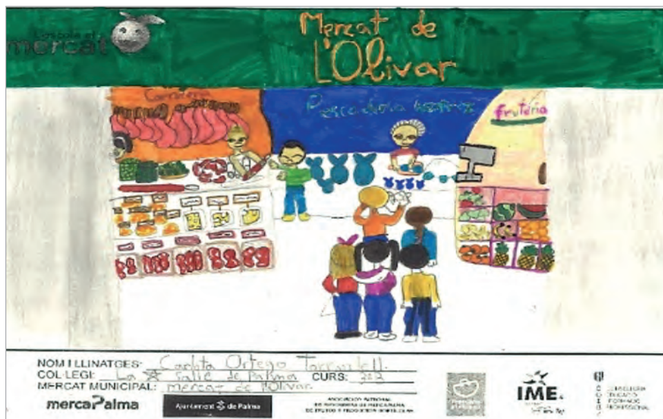
Figura 1. Dibuix guanyador del curs 2022-2023

L'alumnat que participa en l'activitat pot presentar-se a un concurs de dibuix que visibilitza la seva visita al mercat i el que més li ha agradat; s'atorga un premi per curs i per mercat i un premi per categoria. Els primers anys, Mercapalma