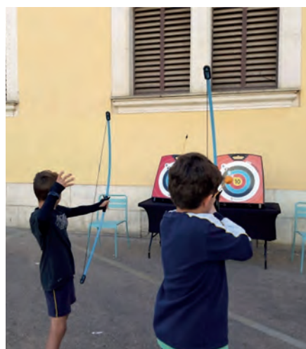
Figura 2. Activitats lúdiques esportives de la gimcana 2022-2023