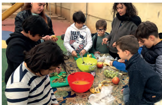
Imatge 6. Els infants de l'Espai Obert Molinar fan un taller de berenar saludable