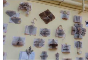
Algunos de los trabajos realizados en el taller Cedia

Este miércoles el centro contará con una exhibición de la artista zafrense Lupe Arévalo y presentará en el FILE su taller 'Libros intervenidos'