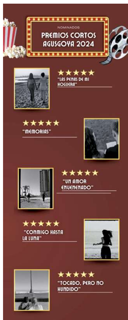
Cartel nominaciones Premios Agusgoya 2024

Del autocuestionario se pudieron extraer distintas conclusiones. En primer lugar, el alumnado consideró que fue más difícil la coordinación del grupo y el manejo del liderazgo que el propio trabajo de creación o el tiempo de consecución de