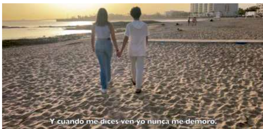
Escena del corto de un grupo del curso 23-24

“No podemos escribir sin haber leído antes”