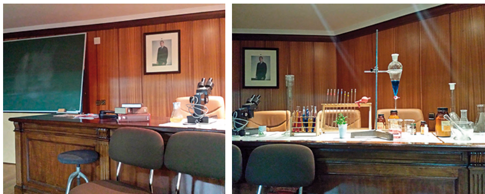
Figura 2. Escenario y parte del atrezzo utilizados en la primera representación de la obra

Finalmente, la obra fue representada el 22 de mayo de 2014, en el Salón de Grados de la Facultad de Ciencias Biológicas y Ambientales, para el resto de alumnos y con libre acceso para todo aquel que se quisiera acercar. La representación teatral supuso la exposición final del ABP de los estudiantes que participaron en ella y fue evaluada (apdo. 4).