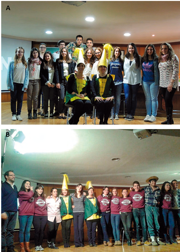
Figura 3. Elenco de actores que participaron en la primera (A) y segunda (B) representación de “La Biotecnología Vegetal como la hubiera contado Charles Dickens: pasado, presente y futuro”.

didáctico para una futura publicación docente. La acogida de la iniciativa por parte del equipo decanal de la Facultad fue máxima y entusiasta. Sus miembros han colaborado en la representación de la obra poniendo a nuestra disposición todos los recursos y espacios necesarios en todo momento y han facilitado su difusión a través de correos electrónicos, el programa de actividades de San Alberto y cartelería.