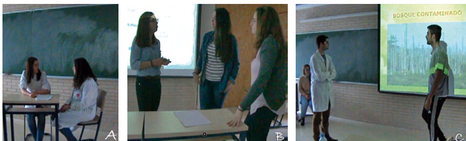
Figura 1. Escenas de pre-exposición en clase correspondientes al pasado (A), presente (B) y futuro (C) de la Biotecnología Vegetal.

Una vez escritas las partes de la obra (pasado, presente y futuro), los alumnos de los 3 equipos tuvieron que consensuar las escenas a incluir en un guion único que, una vez elaborado, debieron editar para dar uniformidad al texto. Otra estrategia que utilizaron con el fin de unificar e hilar la obra fue incluir dos simpáticos personajes inventados, una planta de maíz normal y otra transgénica, que se encargarían de introducir la escena y de guiar al público por la historia, tal como hacen el fantasma de Nochebuena y el Sr. Scrooge en el famoso “Cuento de Navidad” de Charles Dickens (1843). Como no podía ser de otra manera, los alumnos asignaron esos papeles a sus dos profesora. El guion final de la obra realizado por los estudiantes constituyó el trabajo escrito que formaba parte de su ABP y un material evaluable. Sobre este, las profesoras hicimos varias correcciones con el fin de mejorar la redacción, evitar posibles errores en aspectos científicos y cuidar el carácter divulgativo. Como recurso adicional al guion, los estudiantes prepararon una presentación PowerPoint® que debía proyectarse durante la representación de la obra, y que serviría para guiar al espectador y ponerle en situación en algunas de las escenas.