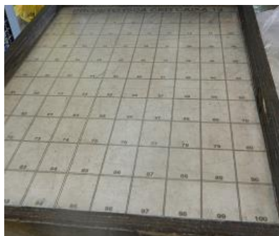
Figura 3 – Tablero de Recuento con Bordes

Al respecto de esta rutina, se destaca lo que podemos considerar la evaluación y mejoramiento de la Solución Asistiva: la Figura 3 retrata el primer tablero de recuento desarrollado en la organización hace cerca de diez años, que fue perfeccionado cuando se eliminaron los laterales. Esta eliminación hizo que el proceso de embalaje se volviera más fácil. Naturalmente, este proceso pasa por cuestiones de aumento de productividad que podría ser objeto de nuestras críticas, pero nos interesa el carácter procesual de las soluciones asistivas, poniendo en evidencia la potencialidad de que estas soluciones evolucionen y se adapten a medida que se vuelve necesario, facilitando la actividad de estos trabajadores o adaptándose a sus necesidades.