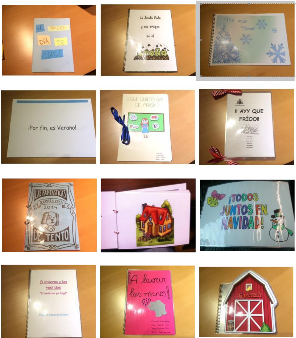
Figura 1. Ejemplos de cuentos adaptados elaborados por el estudiantado universitario para el alumnado de los centros educativos.

La evaluación que se ha venido realizando se concreta en dos instrumentos. Por un lado, los autoinformes que realiza el alumnado universitario participante antes y después del proyecto y donde autoevalúan el desarrollo de las competencias transversales que se recogen en la Memoria de verificación del título de Grado y, por otro lado, las rúbricas que venimos elaborando.