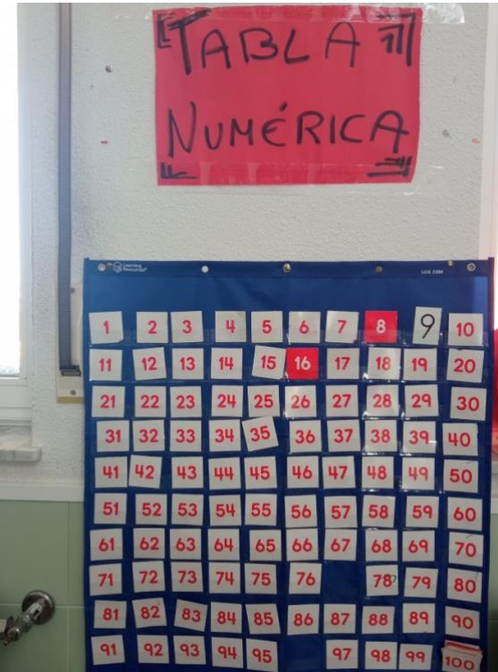
Figura 9. Tabla numérica del ABN.