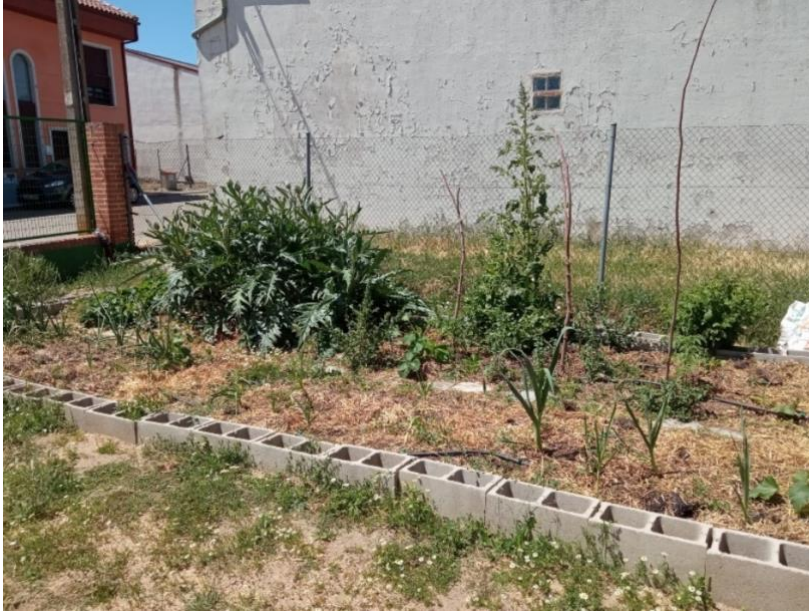
Figura 1. Huerto escolar en mayo de 2022.