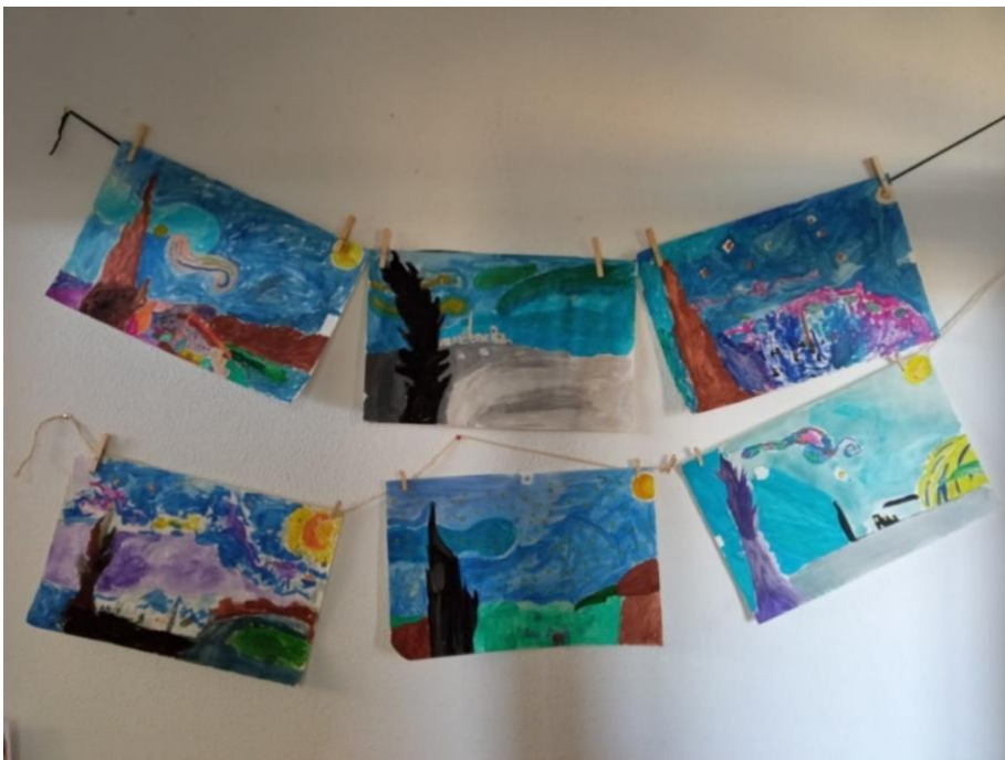
Figura 8. Dibujo cooperativo La noche estrellada .