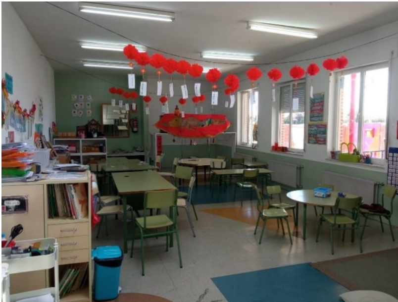
Figura 5. Aula de letras.