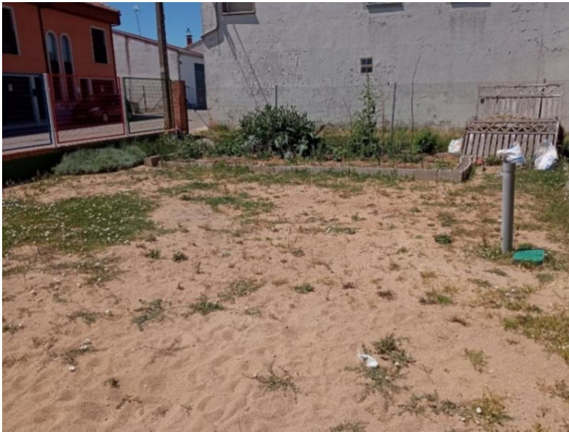
Figura 7. Banco de arena próximo al huerto escolar