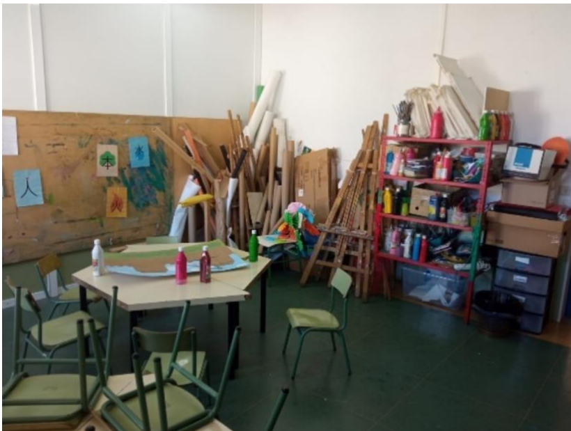
Figura 2. Aula de arte.

En este anexo se recogen imágenes de las habitaciones de Sendas.