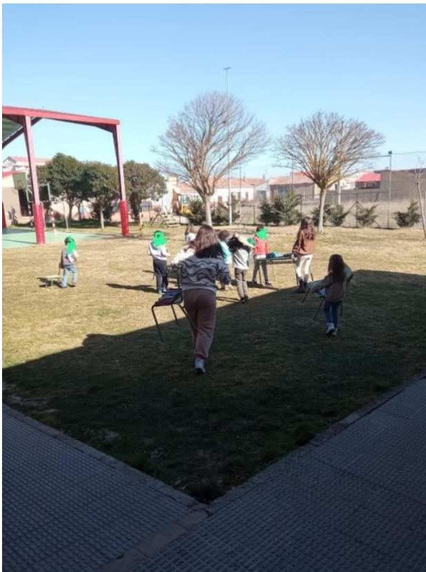
Figura 6. Parte de las zonas verdes de Sendas.