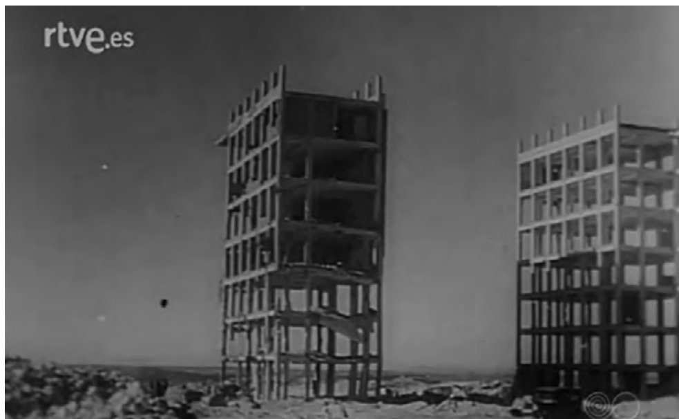
Figura 1. No-Do n. 8A: «En la Ciudad Universitaria de Madrid se procede a la voladura de las ruinas del Hospital Clínico, en lo que fue escenario de nuestra epopeya», 1943

En efecto, sus fotografías requieren pausa y un volver a mirar, a preguntarse y a interpelarse por los vacíos que enseñan, como las partes ya inexistentes de algunos edificios. Esto es muy ajeno a las promesas de construcciones de edificios educativos presentes en los No-Do, explicitado en imágenes, pero sobre todo en las locuciones, que no requieren a priori segundas vistas, ni enfocar la mirada en los detalles ni otras escuchas, como podemos ver en el No-Do n. 8A: «En la Ciudad Universitaria de Madrid se procede a la voladura de las ruinas del Hospital Clínico, en lo que fue escenario de nuestra epopeya» de 1943: 22