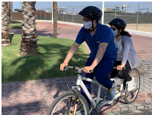
Figura 2. Fotografía de voluntario montando en tándem con la afiliada