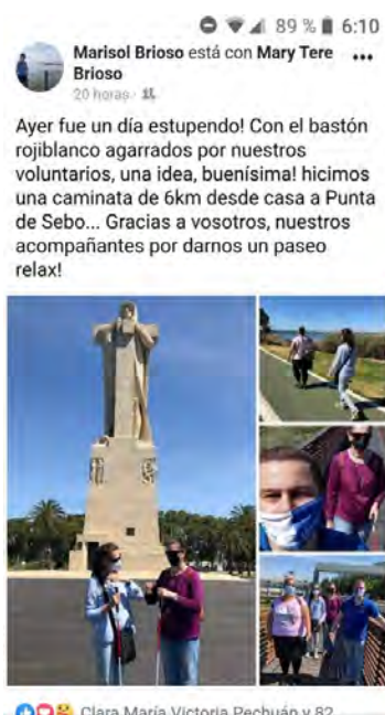
Figura 3. Publicación en Facebook en la que dos afiliadas sordociegas agradecen a los voluntarios su labor