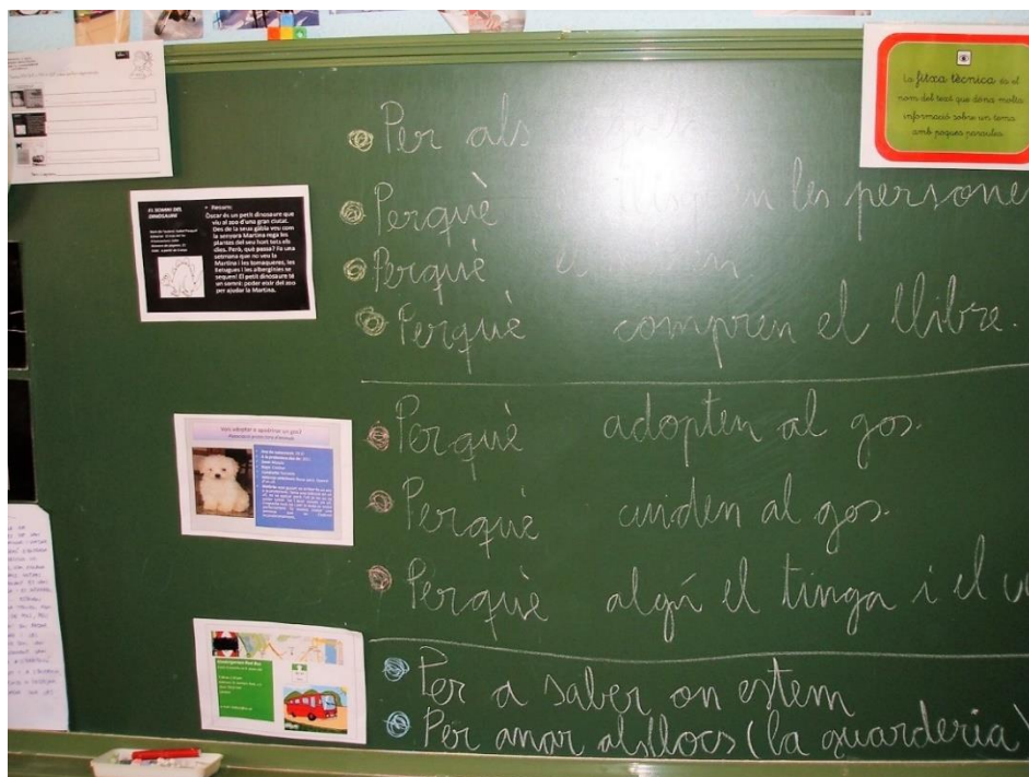
Imagen 1 Ejemplos de textos

La sessió analitzada revela que la activitat alfabetitzadora se desenvolupa en un escenari sociocultural on una activitat dialògica organitzada permet partir de les hipòtesis dels nens sobre el objecte de coneixement i generar aprenentatges (Rojas-Drummond et al., 2020; Rojas-Drummond y Mercer, 2003; Wells, 2015). La conversació pivotada, primerament, sobre la comprensió dels textos (M: este texto/ ¿tú de qué crees que hablará? -15) y, en segundo lugar, sobre los parámetros de la comunicación (X: para que compren el libro (T-74) Para que lo lean (T-58). Además, el diálogo genera una reflexión sobre las características del género que van a escribir. Cabe destacar que los niños entienden una de las características fundamentales: debe ser cortito (194), añaden que son 4 palabras (199).