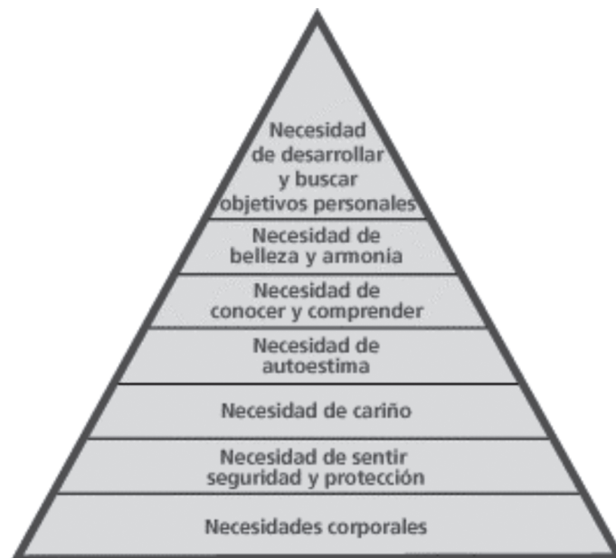
Figura 1: Pirámide de Maslow, tomada de Planned Parenthood Federation of America (2008)

A diferencia de esta postura, la mayoría de los planteamientos teóricos sobre esta temática otorgan a las necesidades humanas un carácter universal, identificándolas con los instintos (Fromm, 1955); con la motivación (Murray, 1938); y con los objetivos y estrategias para evitar graves daños (Bay, 1968; Galtung y Wirak, 1973). Pero sin lugar a dudas, uno de los esfuerzos más importantes por sistematizar una teoría de las necesidades humanas fueron las aportaciones de Maslow (1975). El trabajo de este autor se centró en establecer una jerarquía de necesidades humanas como elemento común a todas las personas; necesidades que actúan como motor del comportamiento humano más allá de las diferencias culturales (ver figura 1). Por tanto, los esfuerzos de Maslow estuvieron encaminados a identificar necesidades humanas universales y a jerarquizarlas. Según este autor, para que se puedan satisfacer las necesidades superiores es necesario que previamente estén cubiertas, en mayor o menor medida, las necesidades más básicas, situadas en la base de la conocida como Pirámide de Maslow .