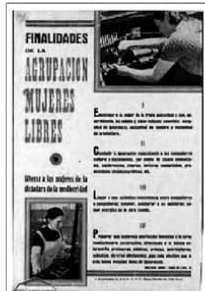
Cartel de Archivo Histórico Nacional de Salamanca. Sección Guerra Civil.

La liberación de la mujer obrera era el objetivo prioritario de Mujeres Libres, porque aquélla era una esclava del trabajo, de la ignorancia y de su condición sexual. Debido a las altas tasas de analfabetismo femenino, la primera tarea de Mujeres Libres consistía en ofrecer una educación básica a las mujeres, para acabar con la esclavitud de la ignorancia. También era necesario que tuvieran una formación profesional para conseguir un empleo que les permitiese la independencia económica 11 . Y por último, la liberación sexual era la clave para que la mujer tuviese la misma libertad que el hombre. El amor libre y la poligamia fueron cuestiones que defendían las anarquistas en contra de la subordinación del matrimonio, ya que este último convertía a la mujer en la esclava del marido 12 . Además, si la mujer era la pro-