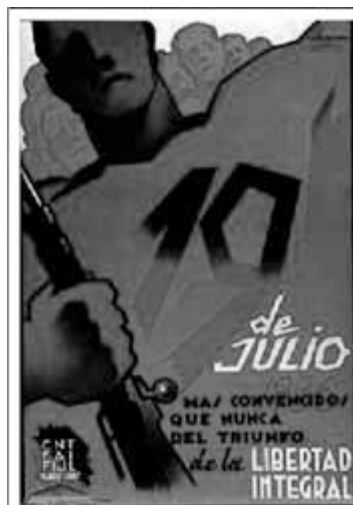
Cartel de Archivo Histórico Nacional de Salamanca. Sección Guerra Civil.

En agosto de 1937 se celebró el primer Congreso Nacional de Mujeres Libres en Valencia. Allí se creó la Federación Nacional de Mujeres Libres y se establecieron las bases de la organización. Mujeres Libres quedó dividida en agrupaciones locales, provinciales y regionales. También se constituyeron un