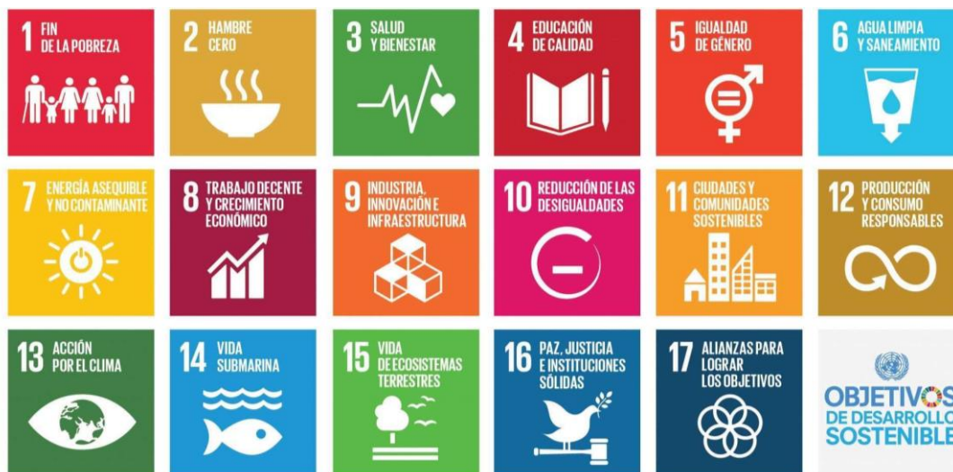
Figura 1. Objetivos de desarrollo sostenible.