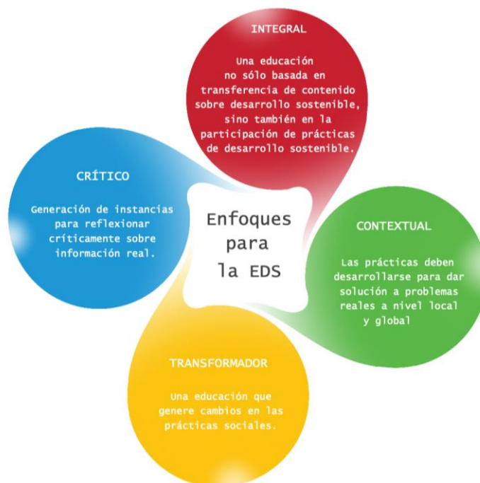
Figura 3. Enfoques para la EDS.

Ahora bien, pese a que la formación para la EDS se ha visto obstaculizada por la falta de claridad sobre cómo llevarla a cabo -pues las características de los procesos de formación pueden ser diversos dependiendo del contexto en el que son requeridos y aplicados-, la revisión de la literatura permite diferenciar elementos básicos para su puesta en marcha (Vare et al., 2019). En este sentido, la UNESCO, a través de su programa de acción mundial para el desarrollo sostenible, establece enfoques (Figura 3) a considerar por el profesorado a la hora de diseñar e implementar procesos de enseñanza con base en la sostenibilidad.