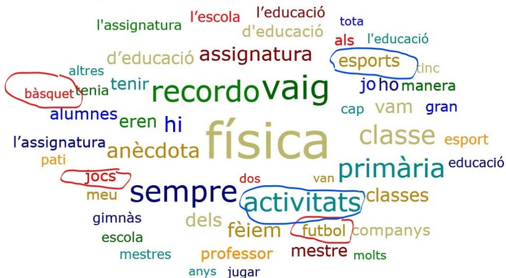
Figura 1. Términos más citados en los documentos analizados

Esta apreciación puede corroborarse considerando la frecuencia de palabras clave relacionadas con este tópico. Tal y como se ilustra en la lista o nube de palabras que mostramos a continuación (figura 1), algunos de los términos más frecuentes pertenecen a este campo semántico: deportes (114), fútbol (100) y baloncesto (72).