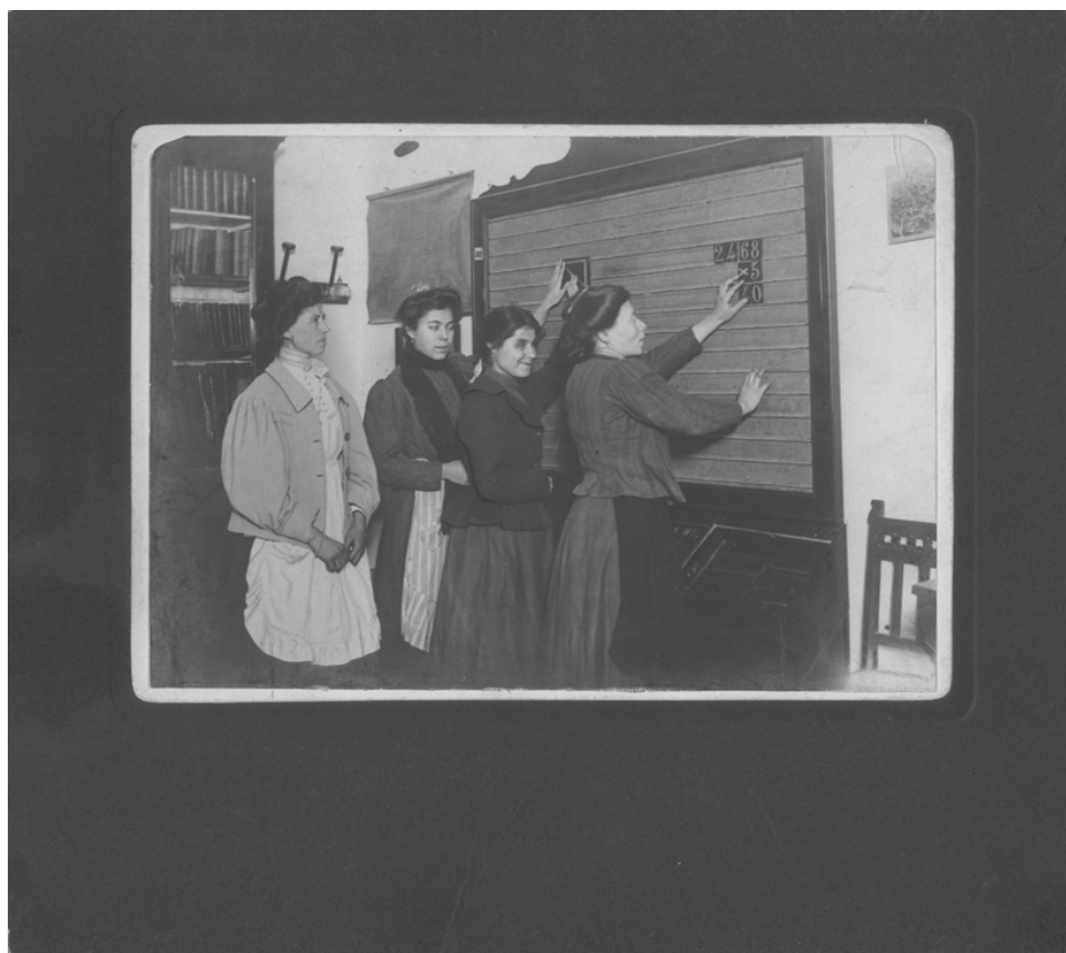
Figura 1. Clase de mujeres adultas ciegas

Díaz, T. (2021). Tres fotografías sobre la instrucción y educación de ciegos a principios del siglo xx en España. RED Visual: Revista Especializada en Discapacidad Visual , 78, 31-44. https://doi.org/10.53094/TPTQ6723 .