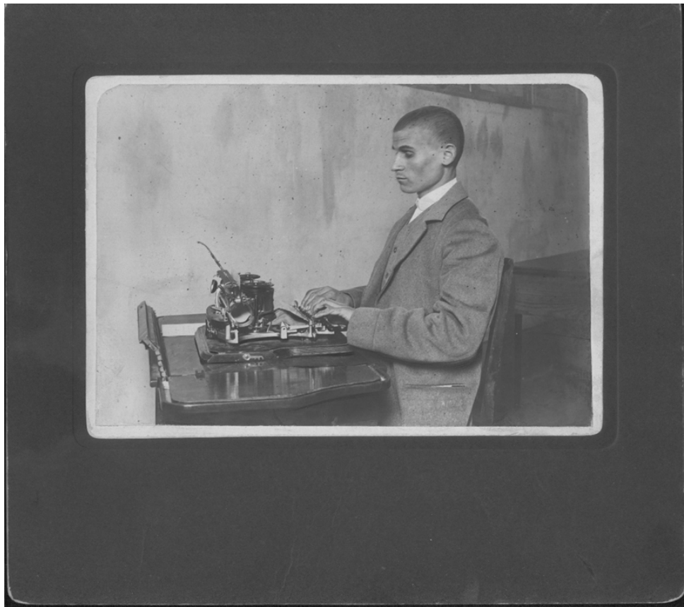
Figura 3. Ciego escribiendo a máquina

La última figura muestra a un ciego adulto sentado delante de una máquina de escribir. Su indumentaria nos indica que era una persona con cierto nivel social, al llevar un traje de buen paño, y con un buen corte de pelo. Al contrario que la moda femenina, en el caso de los hombres el fondo de armario es más reducido y más monótono, al utilizarse el traje siempre que se podía.