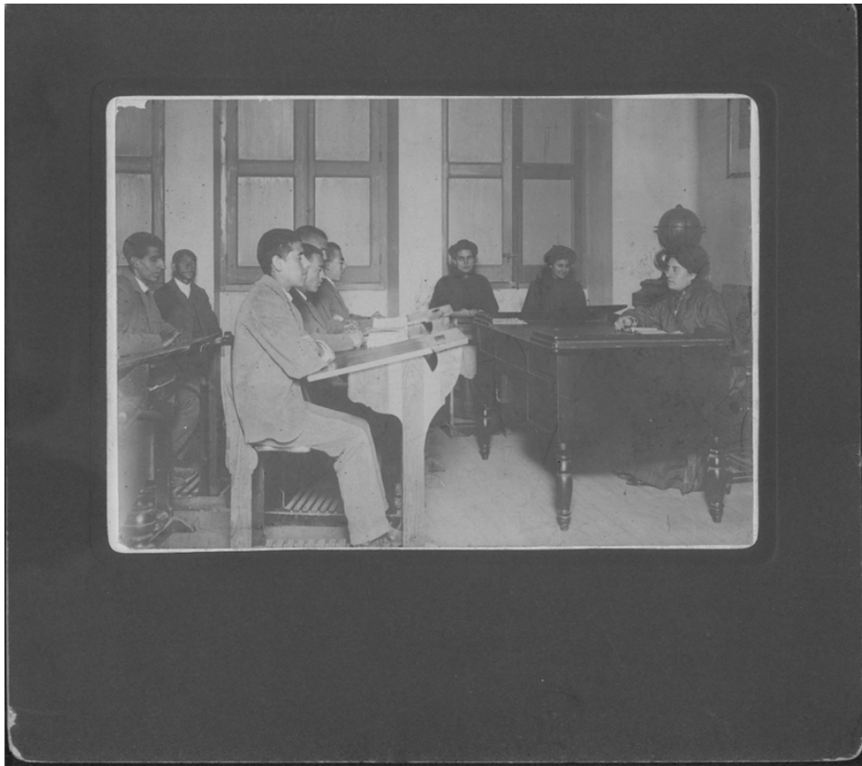
Figura 2. Clase de hombres adultos ciegos