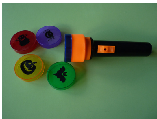
Figura 1. Linterna mágica con cuatro lentes diferentes

Urdangarin, O. (2020). Conjunto de actividades basadas en el desarrollo multisensorial y la alfabetización en braille y tinta para favorecer la inclusión educativa en Primaria de un alumno con discapacidad visual. RED Visual: Revista Especializada en Discapacidad Visual , 76, 115-148. https://doi.org/10.53094/OSKU2586 .