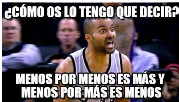
Figura 1. Meme para recordar la regla de los signos para la multiplicación. Elaboración propia utilizando la herramienta online Memegen