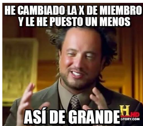
Figura 3. Procedimiento de resolución de ecuaciones. Elaboración propia utilizando Memegen.