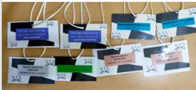
Imagen 3: Tarjetas identificativas por dpto.

También han dado difusión de la empresa a través de la creación de una página web, Facebook e Instagram.