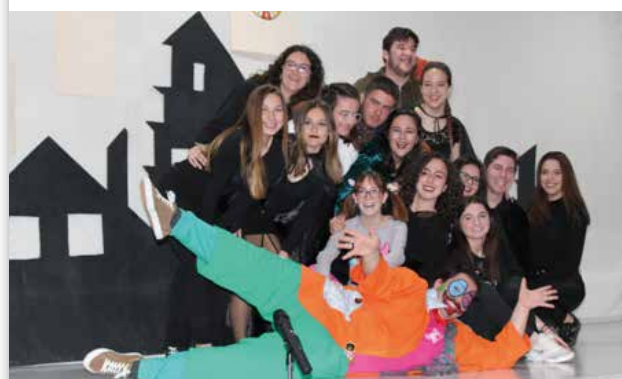
Imagen 11. (Imágenes 9, 10 y 11, escenas del Taller de Teatro “Arriba el Telón”)

A lo largo del proceso, que abarca unos cinco o seis meses, los alumnos participantes se divierten mucho; pero también se requiere una importante dosis de compromiso por su parte, deben tener la responsabilidad y la implicación necesarias para que la obra pueda salir adelante y pueda ser representada que, en definitiva, es el fin último.