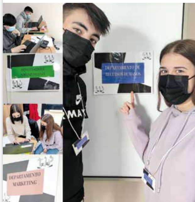
Imagen 1: Organización de los departamentos de la empresa.

en el funcionamiento de cualquier empresa, es una manera de asemejarnos cada vez más a la realidad empresarial. (Imagen 1).