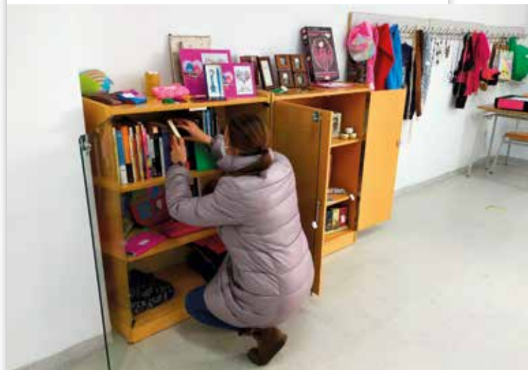
Imágenes 5 y 6: Elaboración del Catálogo y Colocación del Escaparate del Mercadillo Solidario Online (MSO)