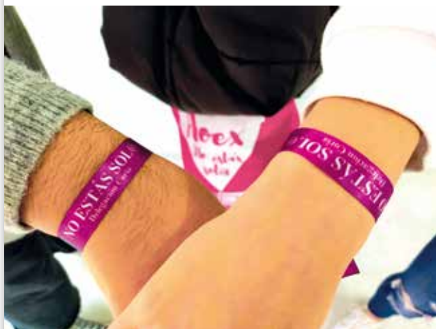
Imágenes 7 y 8: Logotipo AOEX y Colaboración de los alumnos en la venta de Pañuelos y Pulseras AOEX

Aprovechando la campaña de Navidad, la celebración del primer mercadillo solidario online ha sido todo un éxito. La puesta en marcha en su primera edición ha sido una experiencia muy positiva. Los alumnos han mejorado su actitud en clase, ha mejorado el ambiente de aula y el grupo ha afianzado lazos, trabajando en equipo y cooperando entre ellos.