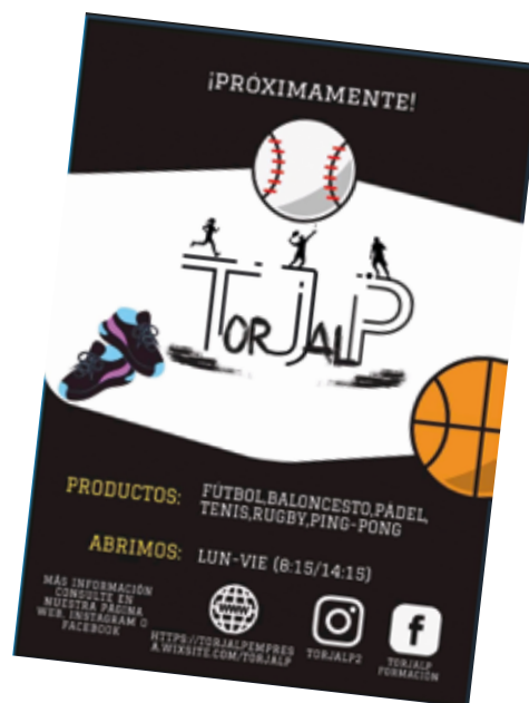
Imagen 2: Póster creado para la empresa.

Departamento de Marketing y Publicidad. Este tipo de departamento se encarga de manejar y coordinar las estrategias de ventas; para ello, nuestros alumnos han ido creando diferentes materiales publicitarios. (Imagen 2)