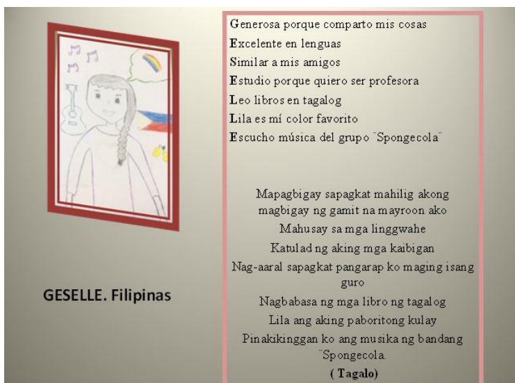
Figura 1. Poema "Acróstico del nombre", bilingüe en español y en tagalo. Geselle, Filipinas.

Presentamos una selección de trabajos del alumnado en los que se recoge el producto final de las diferentes tareas planteadas en el proyecto. En los textos creados por los estudiantes, se puede observar la incorporación de los aspectos lingüísticos requeridos y los puentes que establecen entre sus conocimientos y vivencias previas y las del momento actual.