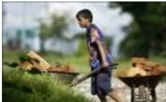
D. Mutiko lanean