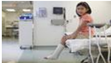
B. Neska ospitalean