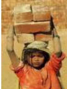
A. Neskatoa lanean

2. Behean argazki batzuk dituzu. Batzuetan haurren eskubideak errespetatzen direla ikusten da, baina beste batzuetan ez. Adieraz ezazu haurren eskubideak zeinetan errespetatzen diren .