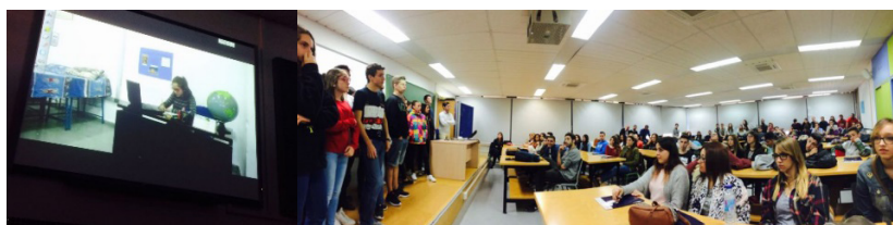
Figuras 4 y 5. Presentación de "Pinceladas de Mujer", IES Huerta Alta. En III Jornadas Clara Peeters y sus otras historias: ¡Empodérate Audiovisualmente! Alumnado del MAES y alumnado de 2º ESO del IES Huerta Alta. Facultad de Ciencias de la Educación, Universidad de Málaga.