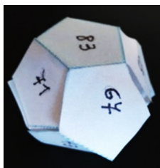
Imagen 1. Dado construido por los alumnos