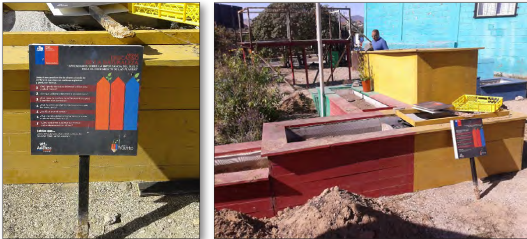
Fig. 1. Estructura física del huerto escolar del Colegio José Miguel Ferreira, Huasco, Chile.

Este huerto fue impulsado en 2013 por el Ayuntamiento, a través de un proyecto del Fondo de Solidaridad e Inversión Social (FOSIS) del Gobierno de Chile. La escuela, gracias al compromiso firme de un profesor, logró mantenerlo por dos años, periodo tras el cual acabó la financiación.