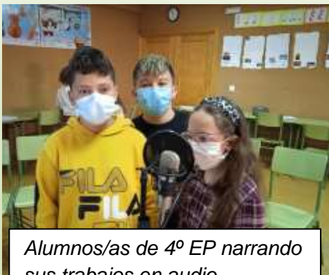
Alumnos/as de 4º EP narrando sus trabajos en audio

Si estás interesado/a en saber más sobre nuestro proyecto visita nuestra web: