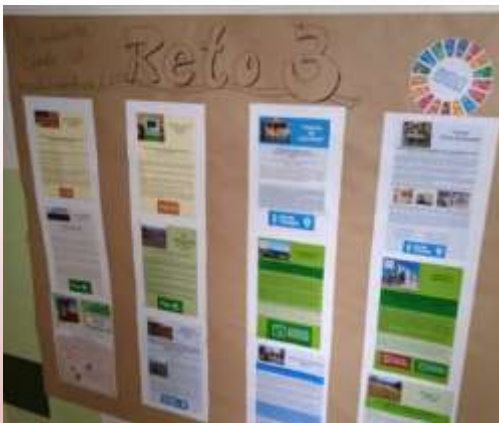
Mural con las fichas elaboradas por cada clase sobre un lugar del pueblo y su relación con los ODS