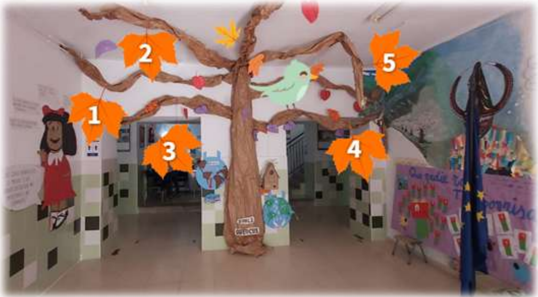
Presentación de “El árbol de los retos” en Genially donde los alumnos veían las tareas y recompensas. https://view.genial.ly/60d0674660a9840df4c0bf0a/presentation-reto-5