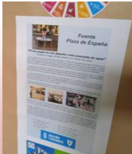
Ejemplo de ficha realizada por la clase de 6º EP que incluye descripción de la Fuente Plaza de España y su relación con el ODS 6: Agua y saneamiento.