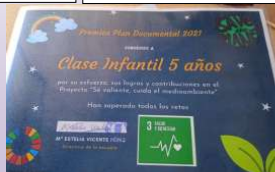
Diploma por el esfuerzo en el proyecto