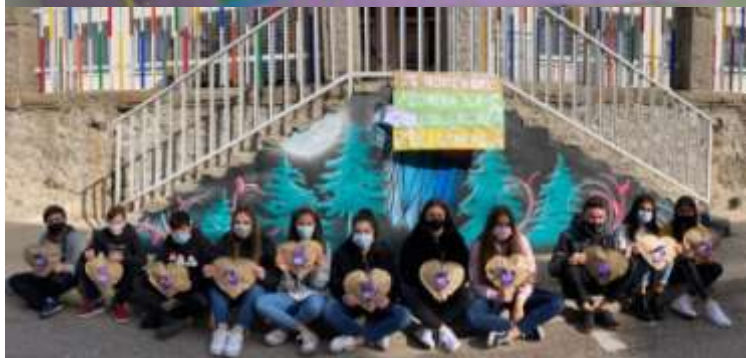
“25-N Contra la violencia de género”