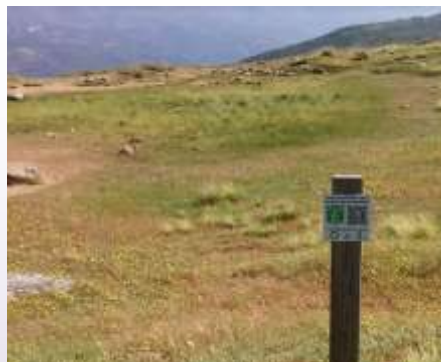
Cartel colocado en La Laguna