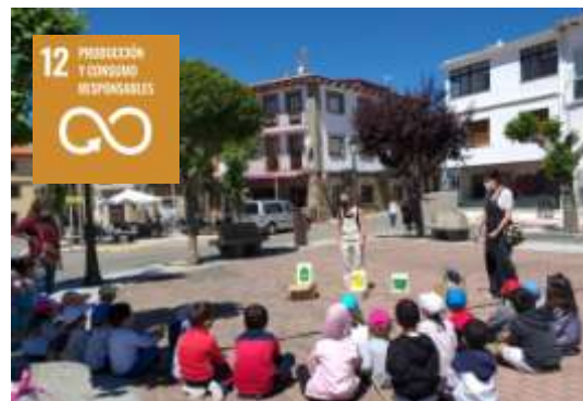
Taller de reciclaje