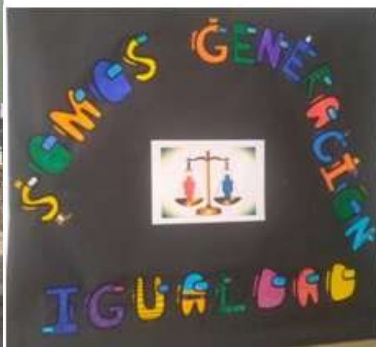
“8-M Objetivo: Igualdad”