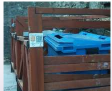
Cartel fijado en punto limpio