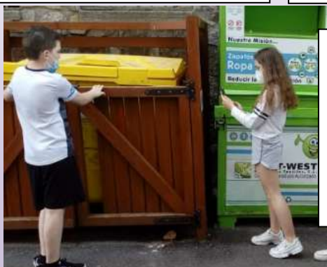
Alumnos/as de ruta aprendiendo a acceder a través de códigos QR