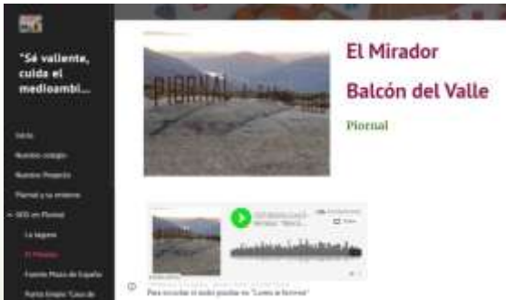
Página web del proyecto con los trabajos de los niños/as

“Si te encuentras malito al médico visitarás, pero si comes frutas, verduras y hortalizas mejor te sentirás”