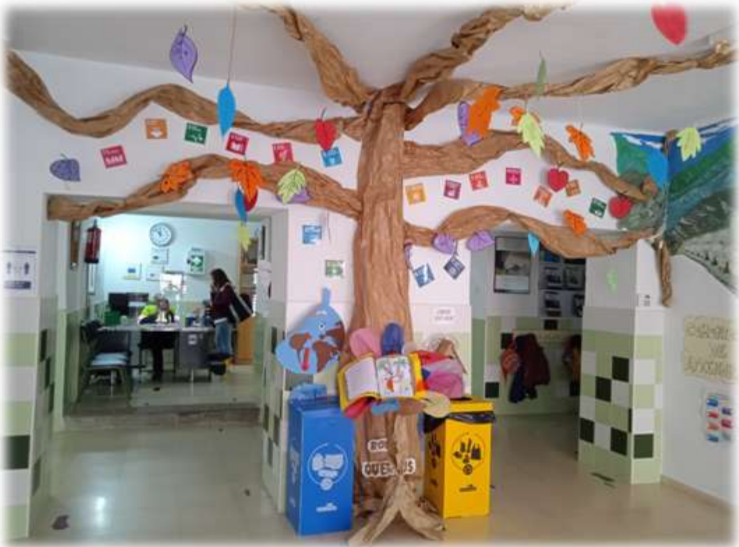
“El árbol de los retos” en el hall del colegio con los logotipos de los ODS