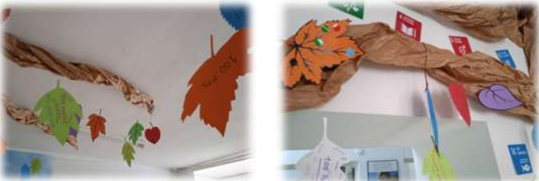
Las hojas representan los retos superados por cada clase y sus puntuaciones