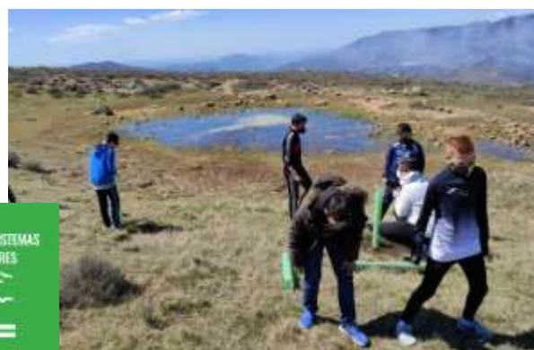
Proyecto de reforestación