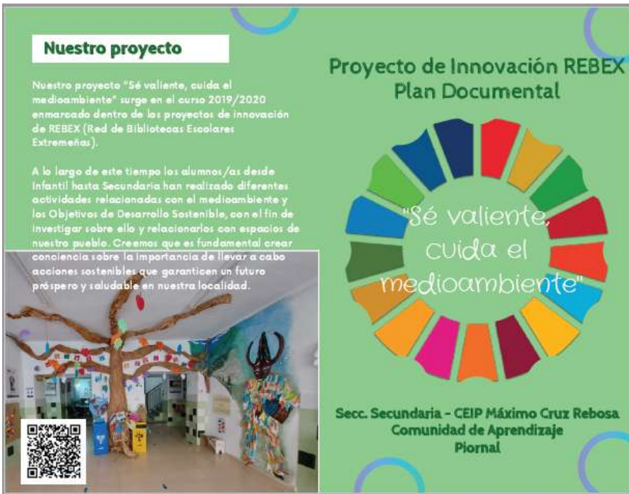
Portada y contraportada

Díptico elaborado para dar mayor difusión al Proyecto “Sé valiente, cuida el medioambiente”. Incluye una portada y contraportada con información del proyecto. En la parte interior aparece un mapa de la localidad con los lugares de interés sobre los que los niños/as han realizado las fichas y donde se encuentran ubicados los códigos QR que enlazan con los distintos apartados de la web del proyecto.