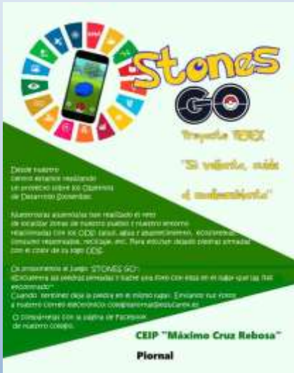
Cartel del juego difundido por las redes sociales.