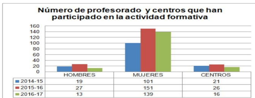
Figura 2. Número de profesorado y centros participantes

Atendiendo a los datos extraídos y analizados de las Memorias de los grupos de trabajo, las Memorias de las Asesorías y la Memoria de los Centros de Formación del Profesorado y de Recursos, podemos concluir que se trata de una actividad valorada de manera positiva por todos los agentes implicados y que ha tenido un elevado impacto considerando la participación de centros y docentes, como se puede observar la Figura 2.