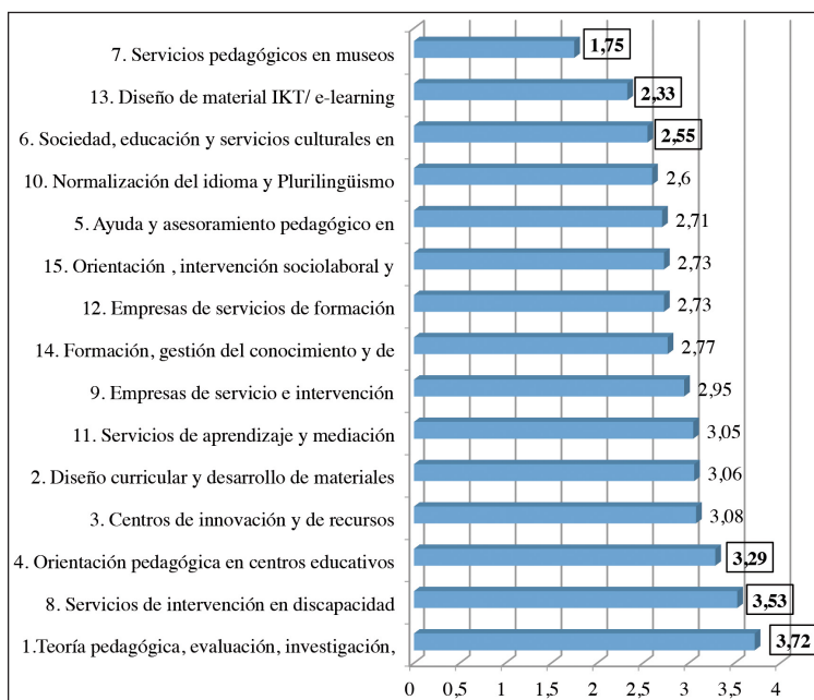
TABLA 3 Percepción de la preparación al mundo laboral en el grado de Pedagogía

Respecto a la preparación al mundo laboral de las asignaturas del grado de Pedagogía (Ver tabla 3), el alumnado (N=266) indica que su preparación tiene que ver sobre todo con la Teoría pedagógica, evaluación e investigación (ítem 1, M=3.72) seguido de los Servicios de Intervención en Discapacidad (ítem 8, M=3.53) y, en tercer lugar, con la Orientación pedagógica en centros educativos (ítem 4, M=3.29). En el extremo opuesto, la salida profesional que menos identifican con las asignaturas del Grado es la de Servicios pedagógicos en museos (ítem 7, M=1.75), Diseño de material TIC/IKT y e-learning (ítem 13, M=2.33) así como lo relacionado con Sociedad, educación y servicios culturales (ítem 6, M=2.55). Ante esto, las propuestas de mejora que el alumnado expone en los focus group respecto a las salidas profesionales, son: conocer las funciones y salidas del pedagogo desde los primeros cursos; impulsar la autonomía de manera que el alumnado tenga margen para la toma de decisiones, organización y la planificación del tiempo; trabajar la crítica y la autocrítica; atender al liderazgo, pudiendo rotar en el rol de gestor o administrador de un grupo con cierta responsabilidad; el profesorado podría facilitar el trabajo cooperativo; trabajar la competencia digital (TICs) en más asignaturas; dar opciones más amplias para desarrollar el practicum en el contexto no formal y conocer otros ámbitos más allá de los centros educativos (empresas, entidades, gabinetes...).