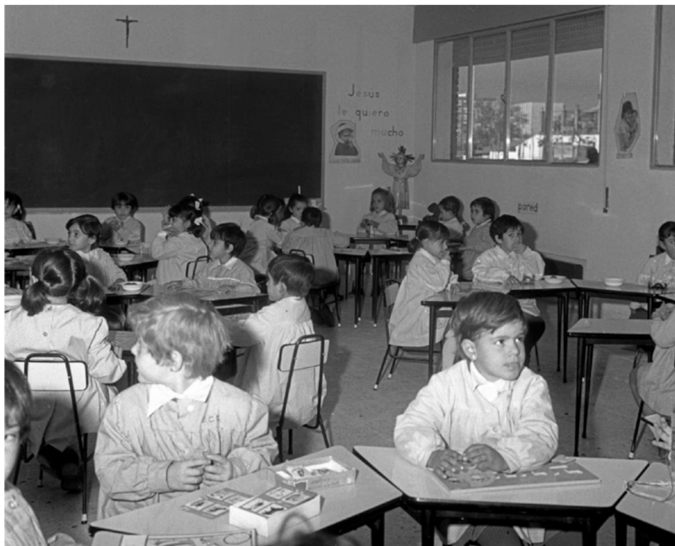
Fotografía 1. Aula de preescolar de uno de los nueve grupos escolares inaugurados en distintos barrios de Madrid, 3 de noviembre de 1970.

Si contrastamos dichas imágenes con las de la misma tipología correspondientes a la etapa educativa de EGB, podremos observar cómo la distribución del mobiliario en el aula se rige por la tradicional orientación de mesas alineadas orientadas hacia el profesor y la pizarra. Una fotografía tomada con motivo de la visita de las autoridades del Ayuntamiento de Barcelona a las nuevas instalaciones de la Escuela del Bosque de Montjuich en octubre de 1972, que por entonces contaba con 560 plazas para alumnos de ambos sexos, constituye un claro ejemplo de lo que venimos diciendo (fotografía 2). En ella, desde la perspectiva del profesor o profesora, podemos ver un aula en la que los pupitres están distribuidos de dos en dos encarados hacia nuestra vista, con los alumnos levantados, ante la visita, a modo de saludo. Pese a que el mobiliario está renovado