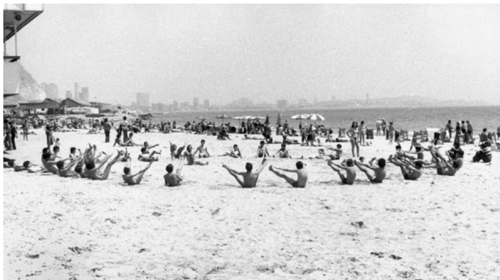
Fotografía 5. Alumnos de un colegio realizando una clase de gimnasia en la playa de El Postiguet (Alicante), 17 de mayo de 1972.

En contraste con el fenómeno de sistemática supresión de escuelas rurales que acontece a finales del franquismo, al tiempo que se construían colegios comarcales con servicios de transporte y comedor —política seguida y prolongada en los años setenta para posibilitar una emulación del modelo colegial, a imagen y semejanza de los institutos de secundaria—, 31 hubo interés por parte del régimen de propagar iconográficamente, a través de fotografías para la etapa de EGB de actividad ordinaria, la extensión de la escolarización a zonas despobladas o barrios marginales. Así, en una serie de ellas vemos a los alumnos de la por entonces considerada escuela más pequeña de España, 32 de un barrio marginal de Alicante, San Agustín, esperando para entrar a las instalaciones ubicadas en una cueva, en una de ellas, y saludando a su nuevo maestro, en otra. Dichas fotografías dan cuenta de la extensión de la enseñanza a zonas marginales, en la década de