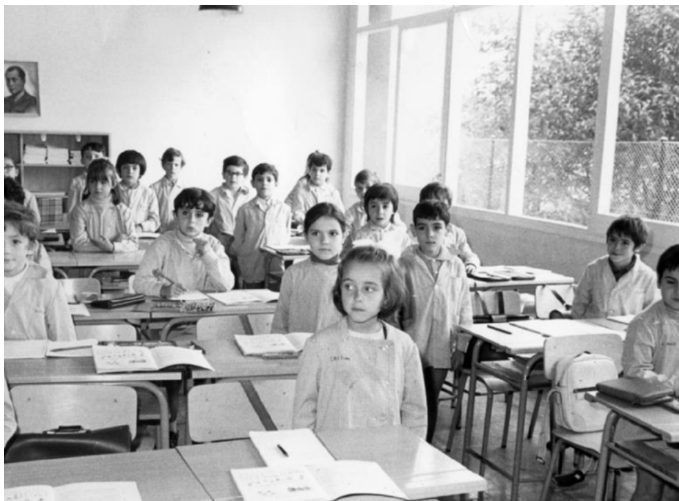
Fotografía 2. Aula de la Escuela del Bosque de Montjuich (Barcelona), 6 de octubre de 1972.

Asimismo, de entre las diversas fotografías de actividad en el aula referentes a la FP podemos destacar dos de ellas que son reflejo de algunos cambios e innovaciones acaecidos en los prolegómenos de la promulgación de la LGE. En la primera de ellas, de febrero de 1970, perteneciente a un reportaje fotográfico sobre la Escuela de Decoración, podemos observar al profesor con las alumnas trabajando. El mobiliario está adecuado a la clase de dibujo y el profesor se pasea entre las alumnas atendiendo a una de ellas. Dicha fotografía, como la que comentaremos posteriormente, da cuenta del acceso de la mujer a la FP, si bien a una formación profesional específica que el régimen, la moral y sociedad conservadora del momento podían considerar adecuada y aceptable, en contraste con un momento en el que ya se habían producido importantes avances tras la aprobación de la Ley sobre derechos políticos, profesionales y de trabajo de la mujer de 22 de julio de 1961 y el posterior desbloqueo del no acceso de la mujer a actividades relacionadas con las armas y los cuerpos