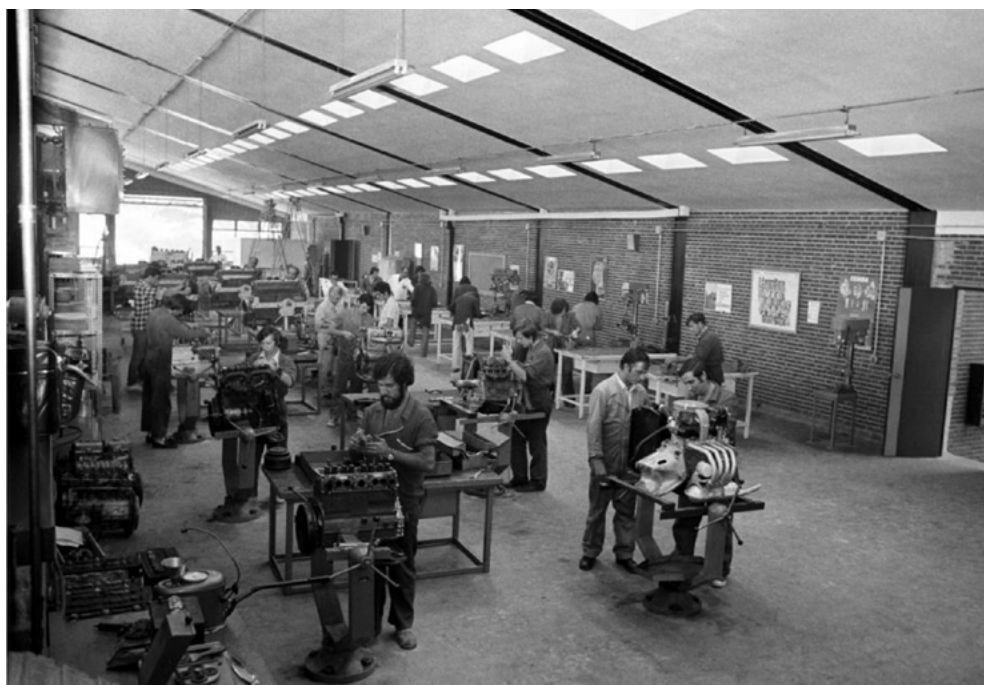
Fotografía 3. Alumnos realizando un ejercicio de mecánica durante un curso de Promoción Profesional del Servicio de Empleo y Ayuda a la Formación en Paracuellos de Jarama (Madrid), 16 de octubre de 1975.

nos da una imagen diferente al ver a los alumnos fuera del centro en una clase práctica en el puerto alicantino donde un pescador veterano les está enseñando a realizar nudos marineros. Dicha fotografía es interesante por reflejar actividades prácticas más allá del propio centro formativo, aprovechando las enseñanzas de profesionales del sector; en definitiva, de una formación profesionalizadora que tiene en cuenta y aprovecha los espacios y profesionales ajenos a la propia institución educativa.