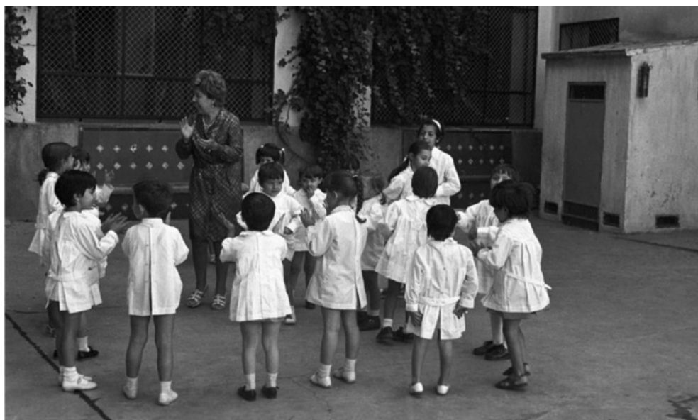
Fotografía 4. Alumnos de párvulos de un colegio público de Madrid jugando y cantando en el patio con su profesora, 25 de septiembre de 1970. Procedencia: EFE / lafototeca.com – TAG ID: efespseven367804 – DocID: 3068784

curso escolar de 1970-1971 en un colegio público de Madrid. En ella vemos a los niños y niñas formando un círculo o corro y cantando con su maestra (fotografía 4). El juego del corro ha sido interpretado como símbolo del grupo y sería susceptible de constituir una señal con efectos propagandísticos. A su vez, el patio se erige en lugar que sirve al fotógrafo para la representación de juegos espontáneos. Los niños y niñas llevan uniforme escolar y la actitud y el gesto corporal es distendido y lúdico. Este tipo de fotografías no son usuales para la etapa de escolarización posterior, la EGB, si bien podemos encontrar algunos ejemplos como una fotografía de septiembre de 1970, realizada con motivo del inicio de curso, de la misma serie que la anteriormente comentada, en que se ve a un grupo de niñas jugando al corro en el patio, vestidas con el uniforme. Una fotografía de mayo de 1972, de alumnos de un colegio de EGB realizando ejercicios de educación física en la playa del El Postiguet de Alicante, es un reflejo del aprovechamiento de los espacios naturales próximos al colegio para la realización de actividades ordinarias, en este caso ejercicios de gimnasia en el transcurso de la clase de educación física (fotografía 5).