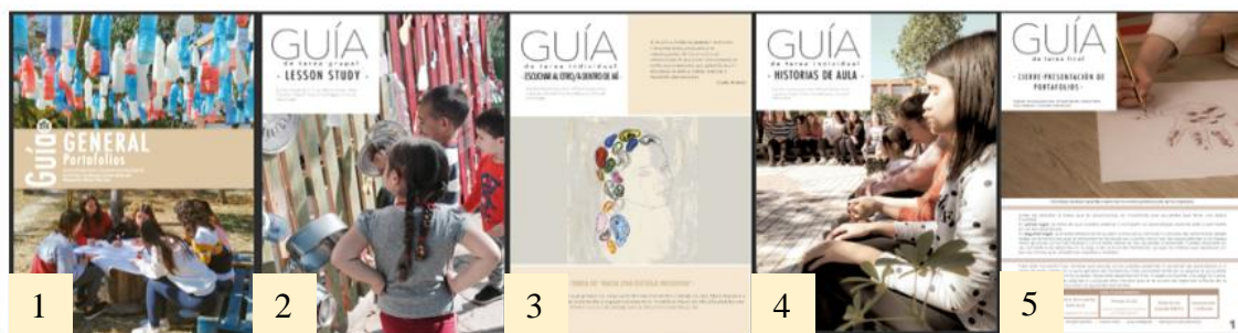
Figura 2. Visual con las guías disponibles para el alumnado.

Todas estas propuestas eran recogidas en sendas guías de orientación [Fig. 2] que pretendían dar a conocer la esencia de cada tarea individual o grupal 6 . Estas guías, además de favorecer la gestión autónoma del alumnado a lo largo de toda la experiencia y hacer más fácil el terreno interdisciplinar que estaban experimentando, fueron muy útiles de cara a nuestra propia coordinación.