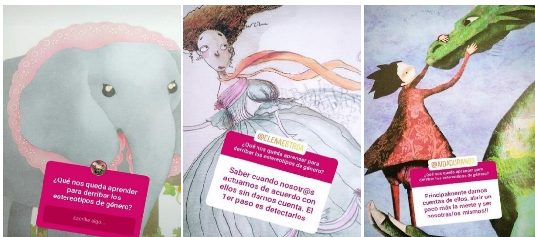
Figura 4. Capturas de una encuesta en stories de nuestra cuenta de Instagram realizada tras una sesión de "Hacia una Escuela Inclusiva" [imágenes utilizadas extraídas de álbumes ilustrados leídos con las alumnas]