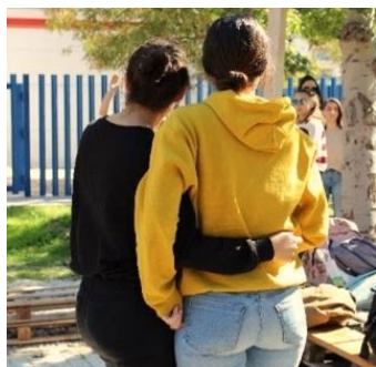
Figura 3. La docencia en sus últimos días de presencialidad

Una experiencia que suponía un desborde continuo de los límites establecidos. Desde: