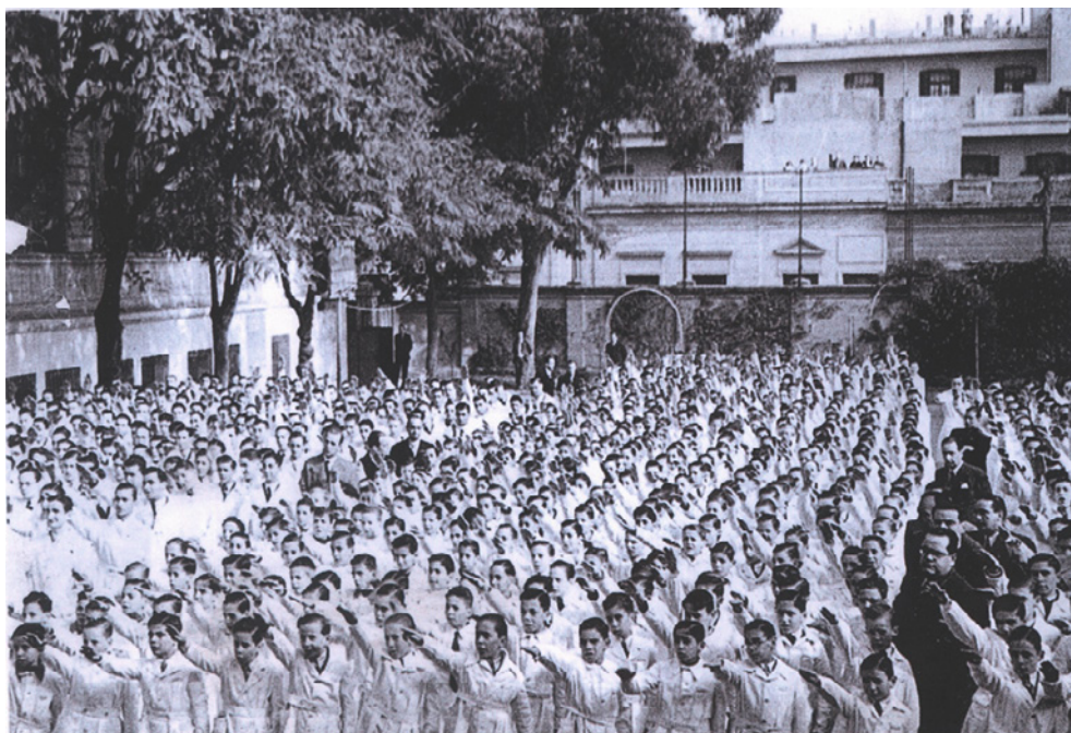
Saludo. Acto en el patio de la escuela, 1937.

En diversos momentos de esos años tuve profesores que hicieron todo lo posible por agruparnos a los muchachos del curso para formar brigadas, [...] para apoyar determinados actos del gobierno de la época —me acuerdo en particular del gobierno del general Justo—. [...] en realidad estaban tratando de crear avanzadas del fascismo, de gente de acción de tipo nacionalista. Todo ello sobre la base de frecuentes manifestaciones de antisemitismo y de xenofobia. 16