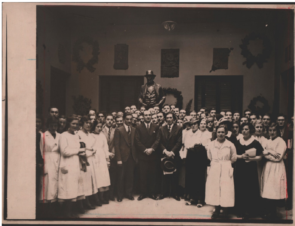
Visita al Museo Mitre. Director y alumnos de la Escuela «Mariano Acosta».