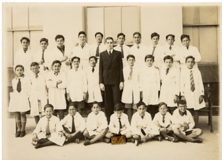
Julio Cortázar, Maestro Normal Nacional