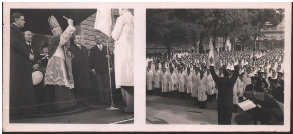
Banda militar y bendición del obispo en el Acto del 22 de mayo de 1937.

Comi instauró en la institución un funcionamiento acorde con las políticas autoritarias de la época. En distintos planos, el Ejército y la Iglesia eran los modelos a los que la escuela normal debía acercarse.