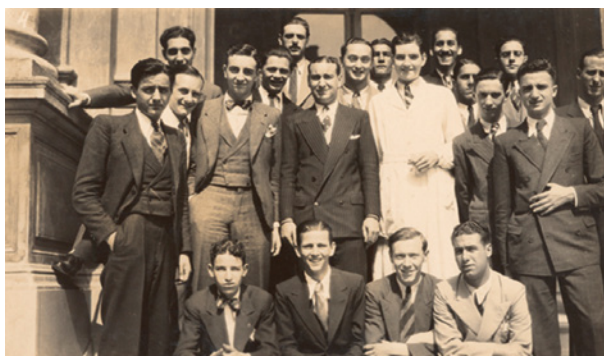
Julio Cortázar en el «Mariano Acosta», 1933

integrados. 11 Pero Julio Cortázar pareciera haber estado destinado a cursar la otra modalidad principal de enseñanza de la escuela media argentina: el Colegio Nacional. 12 Tradicionalmente, esa institución recibía varones provenientes de sectores altos y medios altos destinados a alcanzar los estudios universitarios. Si bien Julio Cortázar cumplía con las condiciones de capital cultural esperado para los ingresantes del Colegio Nacional, el abandono familiar temprano de su padre y las dificultades económicas que esto produjo le impidió alcanzarlo. La opción por la docencia pareció responder más a una imposición social que a una voluntad personal, lo que probablemente —junto con las experiencias concretas que recibió en esos años, como explicaremos más adelante— condujo a Cortázar a abandonar tempranamente esa profesión y a mantener una relación conflictiva con su formación. 13