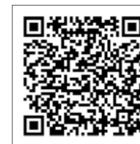
Capítulo 5 VSP