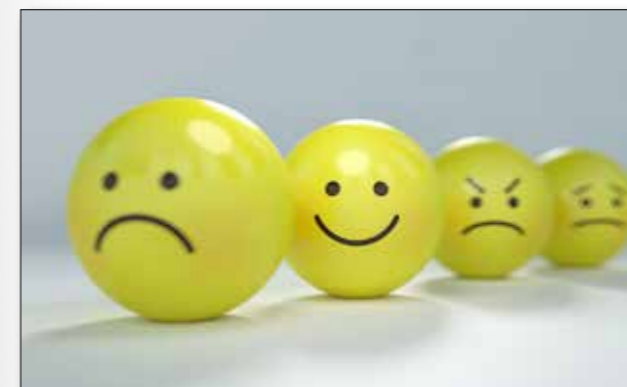
Imagen: <a href="https://pixabay.com/users/absolutvision-6158753/?utm_source=link-attribution&utm_medium=referral&utm_campaign=image&utm_content=2979107">Gino Crescoli from Pixabay</a>

El curso 2020-2021 comienza en plena situación pandémica, con la incertidumbre de otro posible confinamiento. Nuestro Centro, el CEPA Telde-Casco, elabora el plan de trabajo del año escolar. Para dar respuesta a la nueva realidad se inicia el proyecto de Centro titulado GESTOS (acrónimo de Generar Emociones Saludables, Tolerantes, Orales y Sostenibles) en consonancia con los objetivos de desarrollo sostenible de la agenda 2030. Generar emociones orales justifica el uso de la radio escolar y el podcasting.