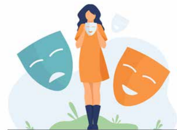
Imagen: <a href="https://www.freepik.com/vectors/woman"> Woman vector created by pch.vector</a>