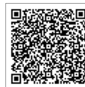
Canal de podcasts en Google

Es un proyecto abierto que se va construyendo a medida que se evalúa el trabajo anterior. Se acuerda incluir bajo el título "Vivir sin problemas" (en adelante VSP), nuevas secciones en el que incorporen elementos de la planificación didáctica de ambos grupos. Por ejemplo, en 3º de EP comenzaron a trabajar la suma de sumandos iguales como introducción a la multiplicación. Esta ocasión es aprovechada por el CEPA para el trabajo de la igualdad, la integración y la suma de iguales. Iniciando así una nueva sección titulada "SOMOS IGUALES, TODOS/AS SUMAMOS" (Capítulo 3).