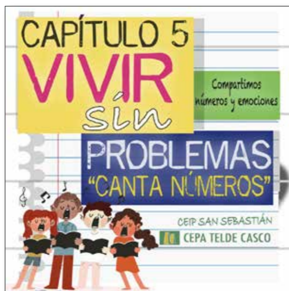
Carteles de elaboración propia

Es fácil colaborar con alumnado de tercero y cuarto de primaria porque ya tienen un dominio de la lecto-escritura y pueden realizar actividades de redacción de problemas, comprensión de textos y resolución de los mismos tanto de manera oral como escrita. El alumnado de FBI también tiene un nivel competencial bastante cercano a estos grupos. (Capítulo 1 y 2).