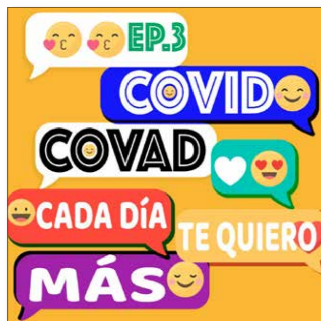
Carteles de elaboración propia

El proceso de trabajo, soportes sonoros, aparatos de grabación y difusión utilizados son los mismos que los descritos para el proyecto de VSP.