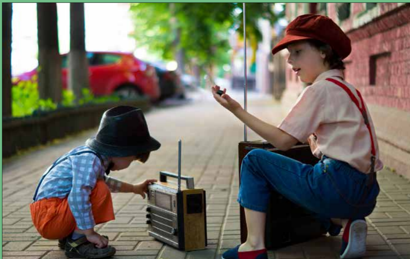
Imagen: <a href="https://pixabay.com/users/victoria_borodnova-6314823/?utm_source=link-attribution&utm_medium=referral&utm_campaign=image&utm_content=2861417">Pixabay</a>

TÍTULO: “EMO-GENERACIONES” AUTOR: Juan Andrés Godoy González