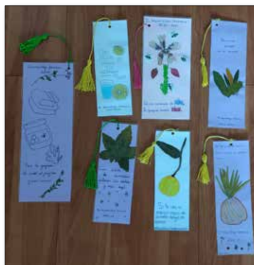
Marcadores de libro

Tras la investigación, llegó la hora de la creatividad. Para ello, se diseñaron diferentes actividades teniendo en cuenta las características psicoevolutivas del alumnado. El alumnado de Infantil creó libros de plantas, los alumnos y alumnas de Primaria realizaron carteles informativos que fueron expuestos en los pasillos del centro. En Educación Secundaria Obligatoria se elaboraron posavaso, marcadores de libros y fanzines para promocionar hábitos saludables relacionadas con los remedios caseros curativos y, además, investigaron e hicieron presentaciones en PowerPoint y exposiciones