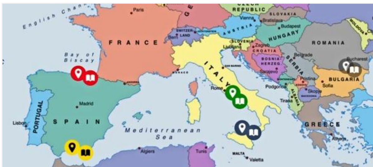
Mapa de centros europeos participantes

En este proyecto sobre "media literacy", el alumnado de 4º de ESO del IES Jardín de Málaga trabajó desde enero hasta junio junto a cuatro institutos de secundaria de diferentes zonas de Europa; el Secondary School with Study of European Languages , en Ruse, (Bulgaria), el IIS Don L. Milani di Gragnano , Gragnano (Italia), el IES Koldo Mitxelena , Vitoria-Gasteiz (España) y el IISS Medi , Barcellona Pozzo Di Gotto (Italia). Este es el mapa interactivo con los participantes: ON THE SPOT MAP