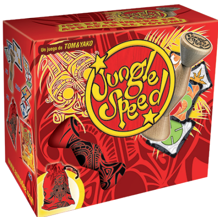
Figura 4. Jungle Speed.

Este juego de cartas se ha convertido en poco tiempo en un popular entretenimiento en reuniones de amigos y se constituye un excelente ejemplo de cómo contribuir a poner en juego y a promover la habilidad de discriminación visual de una forma lúdica y entretenida. Las reglas son sencillas: hay un mazo de cartas con diferentes ilustraciones que se reparten entre los jugadores, todas boca abajo. Gana el juego quien se quede sin cartas. Uno tras otro los jugadores sacan carta y la dejan boca arriba delante de cada uno. Cuando dos cartas que tienen exactamente la misma ilustración coinciden en la mesa (sin importar el color), los jugadores