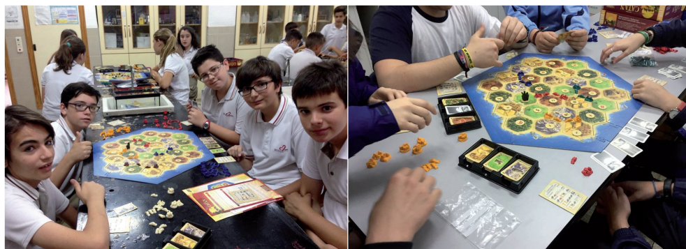
Figura 6 (a y b). Jugando a Catán en clase de matemáticas.

misma línea la amplia gama de juegos de escapismo, tal como la serie de juegos Exit de la editorial Devir, que enfatizan de manera expresa la colaboración entre jugadores.