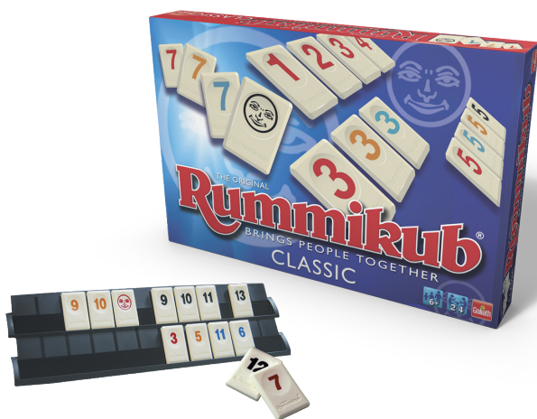
Figura 5. Rummikub.

Este juego tiene un vínculo muy estrecho con habilidades matemáticas básicas relacionadas con los números naturales: composiciones y descomposiciones numéricas, seriación o patrones. Pero más allá de eso, ser capaz de articular un turno bueno en el que te deshaces de alguna ficha mediante la reorganización de las que hay en la mesa, requiere de habilidades de un nivel más alto. En términos de resolución de problemas, mirar hacia atrás o reformular una propuesta de colocación, son heurísticos muy prácticos. Mirar hacia atrás se aplica porque antes de nada debes imaginar en tu cabeza la posible reorganización de las fichas de la mesa para colocar una o varias tuyas. Pero en ocasiones, cuando esos cambios se hacen físicamente, se reorganiza el juego y se cambia el objetivo porque se descubren nuevas posibilidades. Cuando quedan pocas fichas en la reserva,