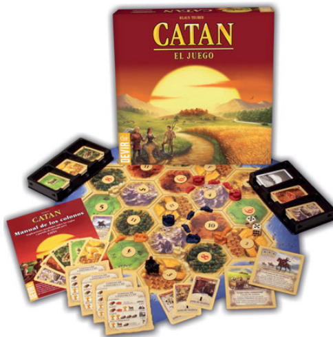
Figura 7. Catán.

Conocido popularmente por Los Colonos de Catán , que fue su primera denominación en España, quizás sea el más conocido y jugado de los que presentamos en este artículo. Se ha editado en más de 15 idiomas, ha sido premiado en multitud de ocasiones, destacando el Spiel der Jahres en 1995, y se realizan competiciones nacionales e internacionales. En la página de la editorial, indicada en el título de la Figura 5, se menciona que se han vendido más de dos millones de unidades y que es un juego que aúna estrategia, astucia y capacidad de negociación. El fin del juego es colonizar una isla y gana el jugador que más expande su control,