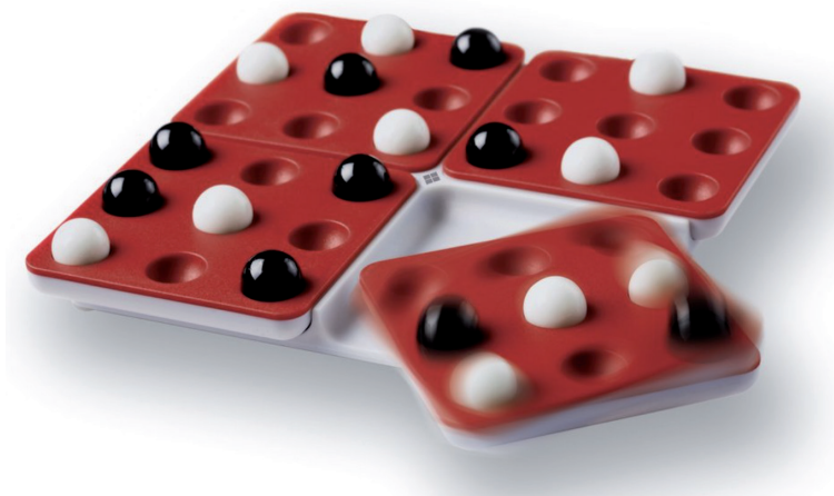
Figura 2. Pentago.

los giros. Ese heurístico se centra en diseñar una actuación en base a pensar primero la situación final que deseo lograr y en este juego eso es fundamental. Por otro lado, es posible jugar con una finalidad de no perder, pero no resulta ni mucho menos tan accesible como en el clásico Tres en Raya. Eso sí, las posiciones centrales son importantes en ambos juegos. Las transformaciones mediante giros son continuas y desde el punto de vista de la visualización, destaca la percepción de relaciones espaciales aunque aplicada al caso del plano, pues sorprende mucho la disposición inicial de las bolitas y las alineaciones que se consiguen girando determinados cuadrantes en uno u otro sentido.