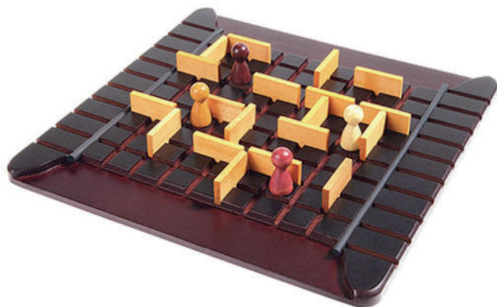
Figura 1. Quoridor.

se reparten proporcionalmente. En cada turno, un jugador puede mover su peón una casilla (hacia delante, detrás, izquierda o derecha), o bien situar un muro entre dos casillas para complicar el recorrido a los contrincantes, sin llegar a bloquear por completo el paso.