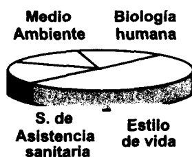
Mortalidad total 1-75 años