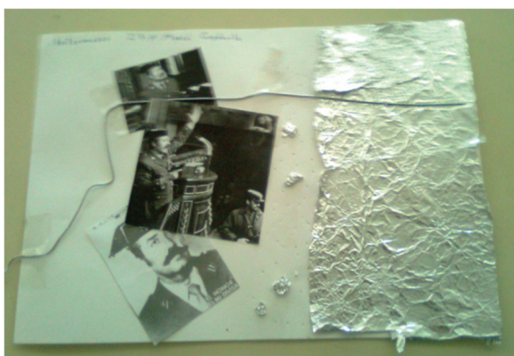
Imágenes 3 y 4: Expresión plástica de Intermezzo 23F , para cinta electroacústica, sonido de campo y viola, de Mercè Capdevila.