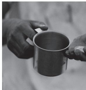
Figura 2. Competencias y cualidades para el ejercicio de la educación social