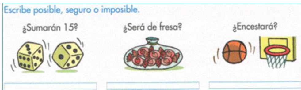
Figura 2 Reconocimiento de tipos de sucesos ([T1], p. 188)