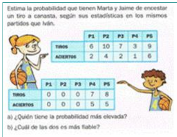
Figura 10. Reflexión sobre la fiabilidad de una estimación de probabilidad ([T5], p. 210)

diferentes para la misma pregunta: “Escribe todos los resultados posibles en la experiencia “lanzar tres tiros libres”” ([T5], p. 214).