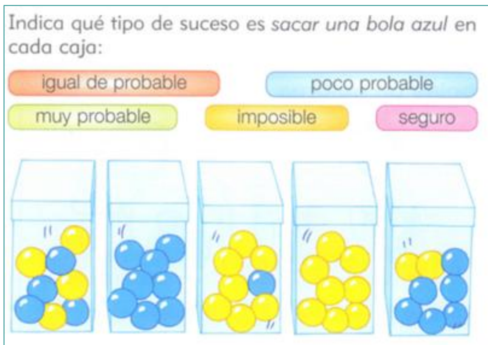
Figura 3. Comparación cualitativa de probabilidades ([T8], p. 125)