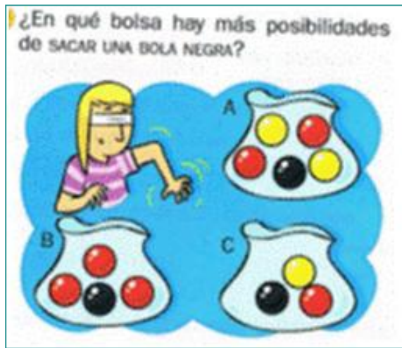
Figura 5. Comparación de probabilidades con razonamiento proporcional ([T3], p. 213)

La probabilidad de un suceso mide la posibilidad de que un suceso ocurra. Para calcularla utilizamos una fracción