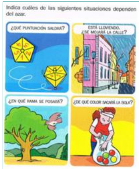
Figura 1. Distinción de fenómenos aleatorios y deterministas ([T3], p. 205)

PRI5. Comparar cualitativamente probabilidades. Dados dos o más sucesos, se pide elegir el que parece más (o menos) probable. Este tipo de actividades aparecen en el ejemplo mostrado en la Figura 3.