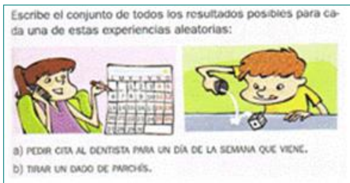
Figura 4. Enumeración del espacio muestral ([T5], p.205)

PRC2. Enumerar o contar casos favorables y posibles. En los textos analizados identificamos dos niveles para este procedimiento, de acuerdo con la complejidad del experimento. El primer nivel trata de enumeración en experimentos simples, donde se pide la lista de posibles resultados sin una técnica, como en la Figura 4.