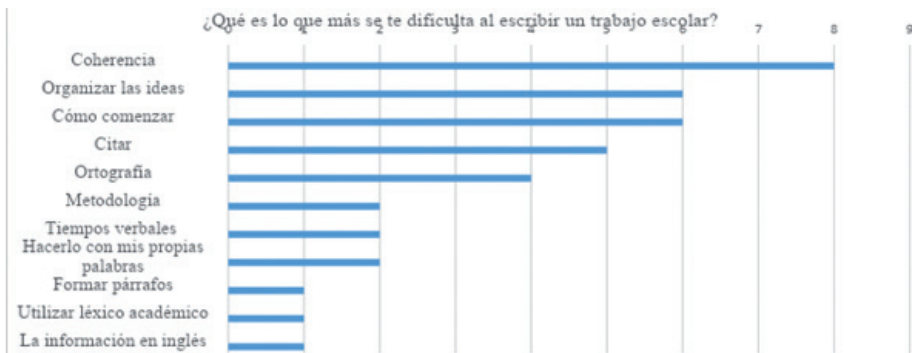
Figura 2. Principales dificultades que presentan los estudiantes al escribir un trabajo escolar

En la pregunta número cinco del ejercicio uno, “¿Qué es lo que más se te dificulta al escribir un trabajo escolar?”, las principales respuestas que se obtuvieron son: “lograr que el texto tenga coherencia”, “organizar las ideas” y “cómo comenzar el texto”, siendo la coherencia el rubro con mayor frecuencia como se muestra en la figura 2. Otras respuestas frecuentes fueron “cómo citar” y “la ortografía”, siendo la referenciación de las fuentes, la inclusión del discurso referido y el seguimiento de reglas ortográficas, elementos que representan cierto grado de dificultad en la elaboración de un texto académico.