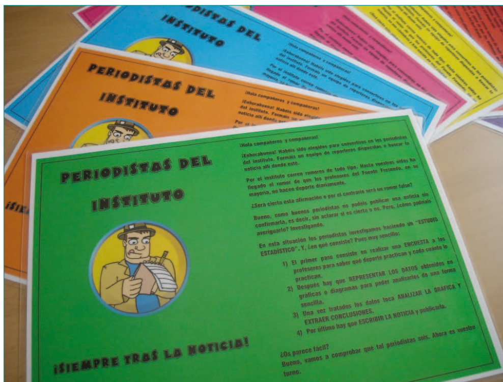
Figura 2. Tarjetas grupales

En cuanto a la contextualización de la actividad, se planteó la asunción de roles por parte de los estudiantes, convirtiéndolos en un grupo de periodistas que se encuentran ante una noticia sin confirmar, especificada en cada Tarjeta Grupal. Se plantearon diferentes temáticas a elegir por el alumnado con un componente motivador común, implicar a los profesores del centro como objetos de estudio. Como todo buen reportero, previa a la publicación, precisa realizar una investigación para comprobar la veracidad de la información. Por ello, a cada grupo de estudiantes se le plantea realizar una recogida de información a través de encuestas diseñadas por ellos mismos, y posteriormente un estudio estadístico de los datos recogidos, a partir del cual extraer las conclusiones necesarias para la elaboración de un artículo periodístico.