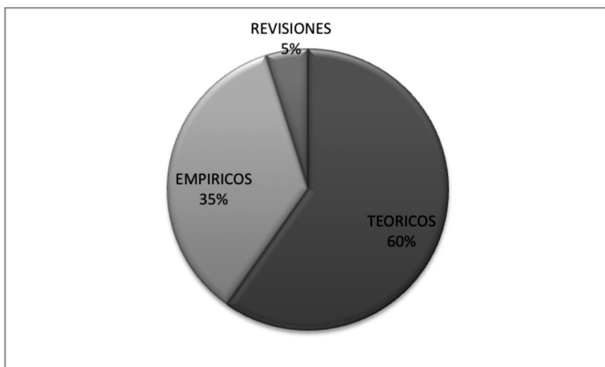
FIGURA 3. Categoría de los artículos.

Del resultado de la búsqueda de artículos se consideró la característica de los escritos diferenciando entre artículos teóricos, trabajos empíricos y revisiones. En la Figura 3 se muestra el porcentaje de publicaciones que corresponden a cada ámbito. Se observa en los trabajos estudiados una diferencia significativa en el matiz de las publicaciones a favor de los escritos teóricos que representan el 60% de los artículos, con un 35% de contenido empírico y la representación de un 5% en la edición de revisiones.