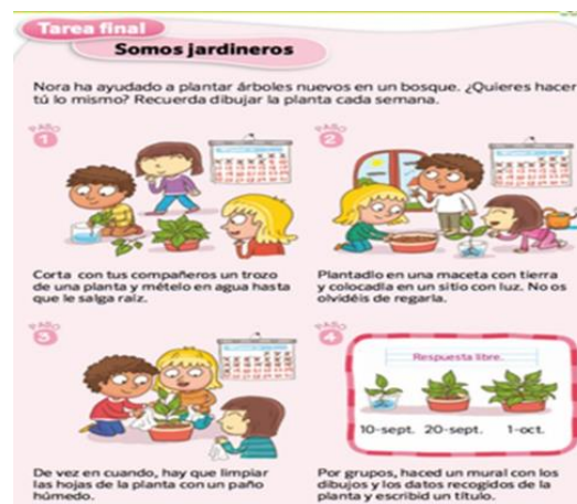
Figura 4. Actividad Enfoque anidada (T8, p. 21)

La siguiente actividad, presentada en la Figura 4, se considera clasificada dentro del enfoque de integración anidada, porque deben utilizar conocimientos de otras disciplinas para dar solución al problema que se formula. De manera guiada, seleccionan la información con la cual podrán organizar los pasos que llevarán a la concreción del proyecto científico. Mediante la matemática tendrán que registrar cada evolución de la planta, cantidad de agua necesaria y volumen de tierra para fortalecer la raíz de la planta y obtener diversas conclusiones, utilizarán la tecnología para complementar los conocimientos que harán que el proyecto funcione, buscando generar condiciones atmosféricas orientadas a beneficiar el éxito de la actividad. Cada una de estas actividades está siendo aplicada en la asignatura de ciencia mediante el desarrollo del método científico, dicha disciplina se nutre de las demás áreas para lograr el objetivo formulado.