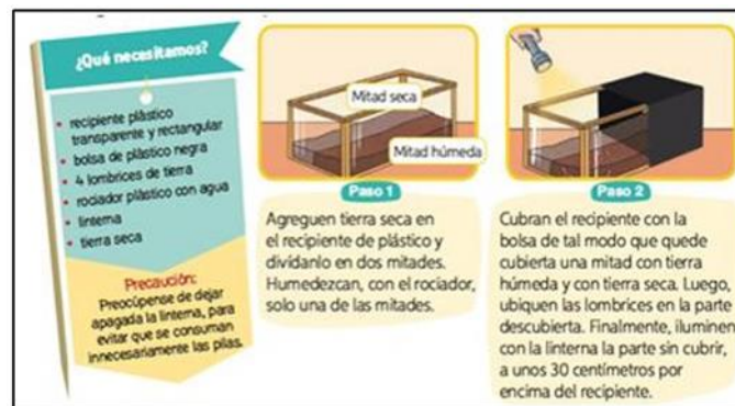
Figura 9. Enfoque interdisciplinario (T2, p. 118)

En la Figura 9 se observa que, mediante la interacción de variados conocimientos disciplinarios, los estudiantes deben recrear diferentes ambientes, mediante implementos reciclados, reproducen el hábitat de las lombrices. Se evidencia el fortalecimiento de diversos conocimientos, matemáticos, tecnológicos y aplicación de soluciones mediante el ingenio, al ser una actividad que busca conjugar áreas transversales de la educación logra un mayor nivel fortalecimiento en la interacción de disciplinas académicas.