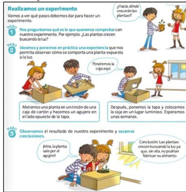
Figura 10. Enfoque participativo y colaborativo (T8, p. 18)

Para establecer un análisis sobre la cantidad de actividades y su categorización, según el enfoque de perspectivas presentes en las actividades STEM en textos españoles y chilenos, realizamos la Tabla 8. En ella, se manifiesta un claro predominio del enfoque experiencial (60 actividades: 37 en los textos chilenos y 23 en los españoles), teniendo que dicho enfoque busca utilizar las experiencias y conocimientos previos de los estudiantes, para de esta forma encontrar la solución al ejercicio inicial. De igual modo, el enfoque práctico es el segundo más trabajado, a consecuencia que los ejercicios analizados buscan en su gran mayoría la manipulación y la práctica de las actividades. En contraposición, encontramos que el enfoque interdisciplinar (12 actividades) es el menos observado, entendiéndose que este tipo de categoría busca la conexión entre diversas áreas de la educación, lo cual representa un desafío en la construcción y posterior aplicación de la actividad.