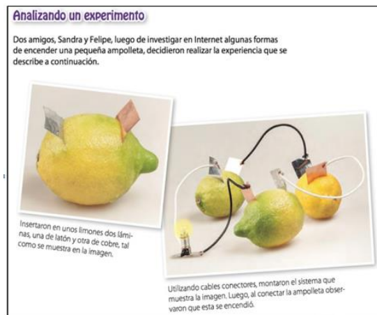
Figura 3. Actividad enfoque conectada (T5, p. 152)

La actividad que se observa en la Figura 3, busca que los estudiantes reflexionen, investiguen y tomen decisiones a lo largo de todo el proceso de trabajo. Se destaca la presencia de las 4 disciplinas, las cuales son abordadas de forma ordenada y sistemática, se identifica como mediante una planificación ingenieril, los estudiantes deben buscar lograr la mayor cantidad posible de energía para poder encender la bombilla. En esta actividad existe la conexión específica entre dos disciplinas, mediante el desarrollo de la experimentación en ciencias y la aplicación de recursos tecnológicos, es posible dar solución a la actividad.