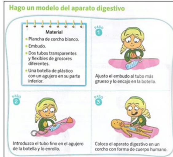
Figura 8. Enfoque práctico (T8, p. 52)

aprendizajes futuros; a consecuencia del experimento realizado. Con ello, se espera comprender el funcionamiento y componentes del aparato digestivo a través de puesta en práctica de sus conocimientos.