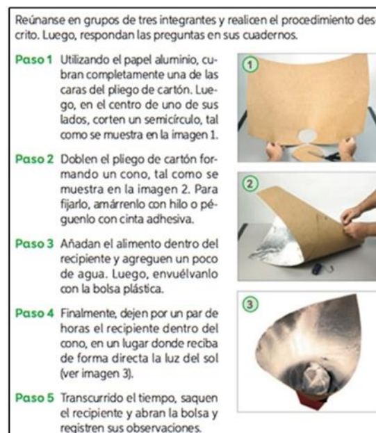
Figura 7. Enfoque crítico (T6, p. 177)

A través de la actividad de la Figura 7, y mediante la construcción de una cocina solar, es posible ver cómo y de forma crítica los estudiantes lograrán dar solución a un problema presente en diversas comunidades del mundo. En ella, energía es un bien escaso, junto con el desarrollo de la actividad y de forma paralela se genera una conciencia social sobre los recursos naturales; dicho aprendizaje beneficiará de forma directa la enseñanza de otras disciplinas académicas transversales a la ciencia y de orden formativos en valores sociales.