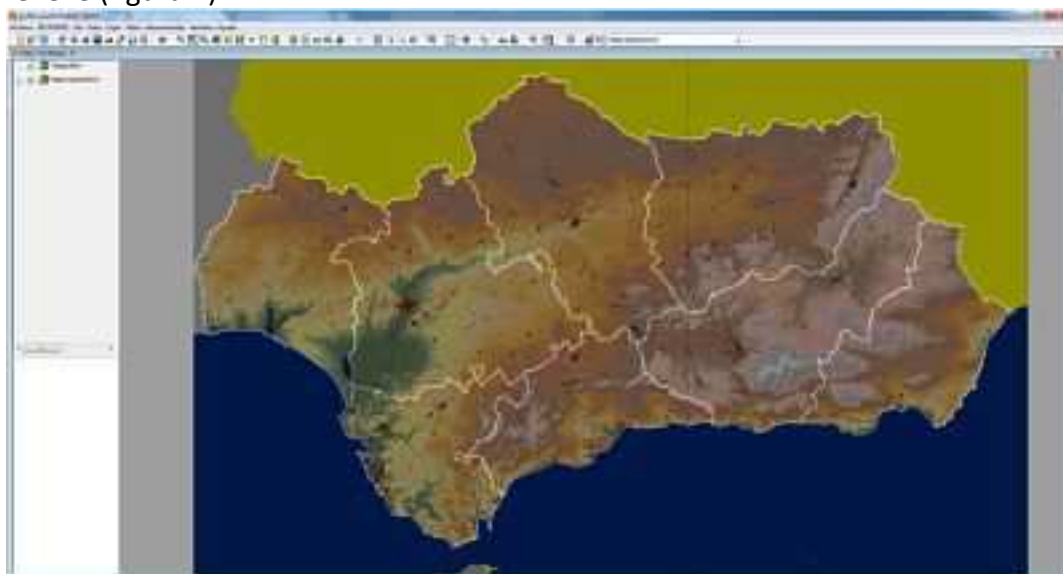
Figura 2. Superposición de WMS en gvSIG: mapa de altitudes y mapa topográfico de Andalucía (visible a escalas mayores)

Para el modelado del relieve terrestre, se propone recurrir a un mapa de altitudes de Andalucía y centrarse en la Depresión y el entorno del Guadalquivir. Debido a su considerable tamaño y su evolución geomorfológica, su orografía aporta una idea muy clara de lo que significa un relieve y de qué procesos externos e internos lo van configurando, dando lugar a distintos paisajes como el modelado fluvial, litoral, kárstico, etc. Permite un fiel estudio de los sistemas morfoclimáticos de zonas templadas pero, al mismo tiempo, observando el área a sotavento de los relieves de cabecera, también aporta información de modelados subdesérticos. Por otro lado, la superposición del mapa topográfico ayuda a aprender cómo se representa e interpreta el relieve (figura 2).