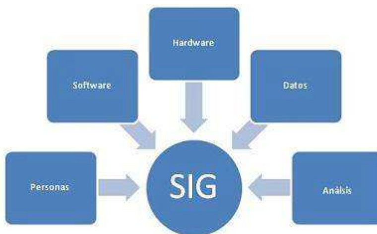
Figura 1. Elementos integradores de un SIG

La aplicación de las TIC al mundo de la cartografía supone en la actualidad la divulgación masiva de imágenes espaciales y el desarrollo de nuevas técnicas de análisis y de conocimiento (Luque Revuelto, 2011). Una de las herramientas espaciales que más se ha desarrollado en los últimos años son los Sistemas de Información Geográfica (SIG). El término "SIG" suele aplicarse a sistemas informáticos de gestión de datos espaciales que constituyen la herramienta informática más extendida en la investigación en Ciencias de la Tierra y Ambientales. Los SIG han pasado a ser sistemas que integran tecnología informática, personas e información geográfica (figura 1), y cuyas principales funciones son capturar, analizar, almacenar, editar y representar datos georreferenciados (Korte, 2001).