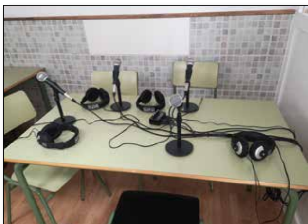
Es el estudio de radio del IES María Pérez Trujillo.

Con este artículo pretendemos compartir precisamente lo que hemos aprendido y los ejercicios