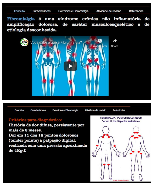
Figura 1. Capturas de tela do material autossuficiente de estudos elaborado na plataforma Wix.

O material autossuficiente de estudos foi criado na plataforma Wix e disponibilizado num grupo fechado da turma no Facebook, através de um guia de aula que continha todas as informações sobre a atividade e o link do material de estudo (Figura 1). O Wix 1 é uma plataforma que possibilita elaborar sites por meio da edição e incorporação de materiais multimídia (Abellan, 2015). Os materiais criados através desta plataforma podem ser considerados eficientes pela agilidade e tempo para sua construção (Costa et al., 2014). Segundo Ferreira, Corrêa e Torres (2013) o Facebook proporciona ao professor diferentes formas para incentivar e motivar o estudante no seu processo de ensino-aprendizagem. A Figura 1 apresenta capturas de tela que exemplificam o design do material elaborado na plataforma Wix.