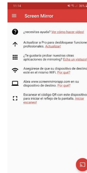
Figura 1. Pantalla inicial de Screen Mirror.