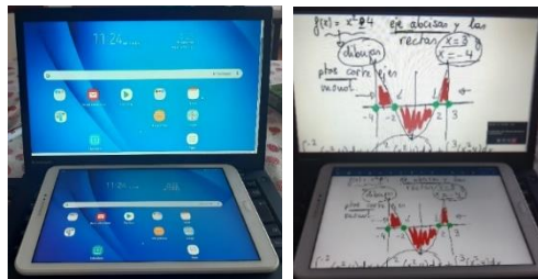
Figura 3. Pantalla compartida.